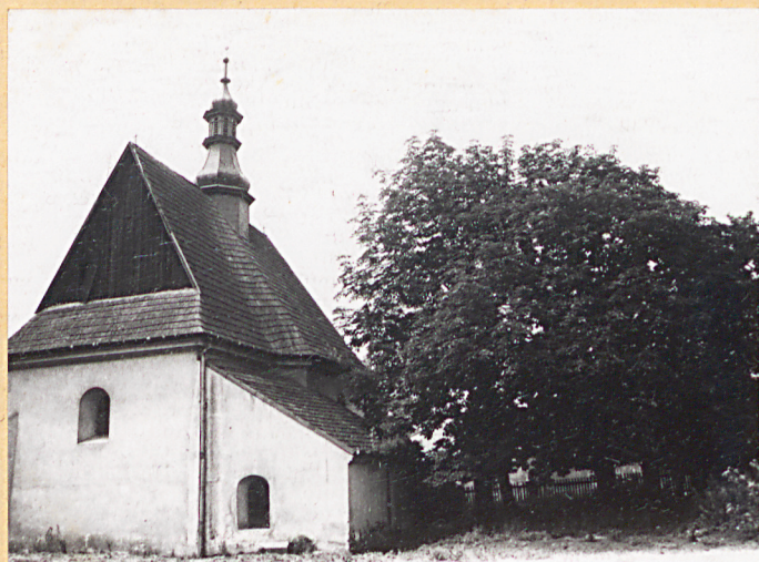
2. Cmentarz. Widok ogólny.