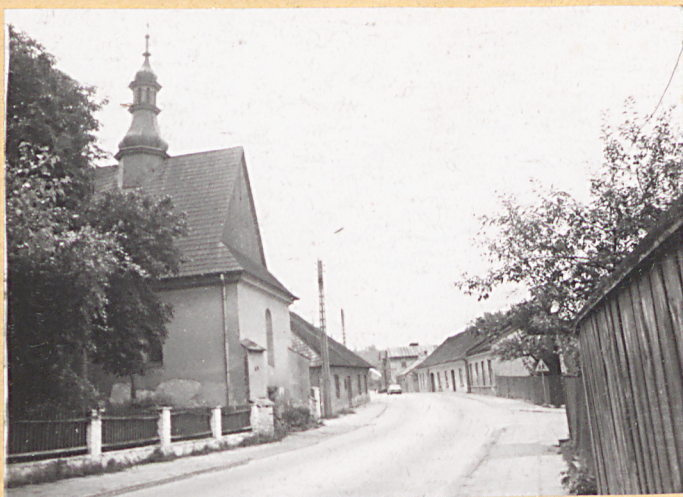
1. Kościół św. Ducha przy ulicy Podzamcze /droga wylotowa do Ostrowca/.