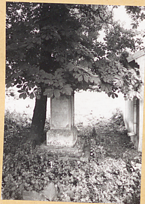
4. Nagrobek M. Baszczyńskiego /+ 1801v./.