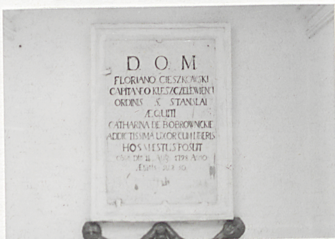
3. Tablica inskrypcyjna.