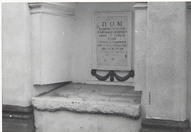
2. Środkowa część grobowca.