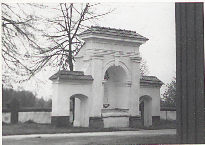
1. Widok grobowca.