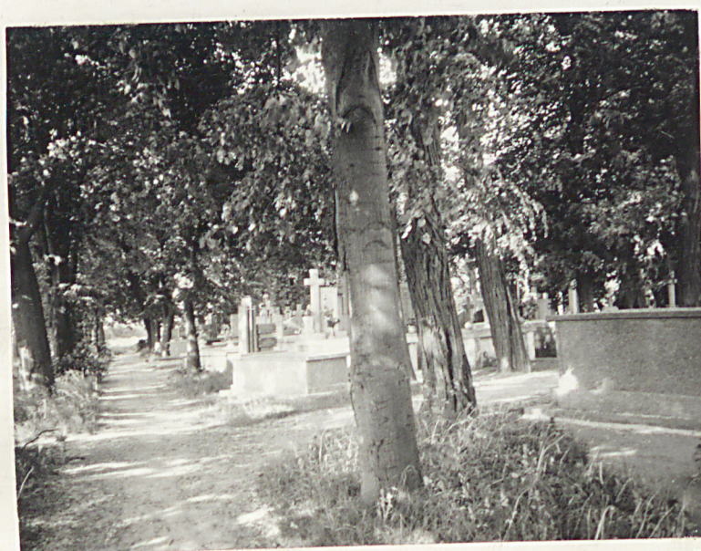
FOT.6 - ALEJA WZDŁUŻ POŁUDNIOWO- WSCHODNIEJ GRANICY CMENTARZA