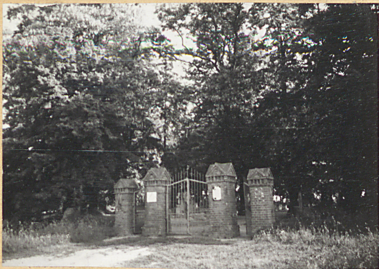
FOT.1 - BRAMA CMENTARNA