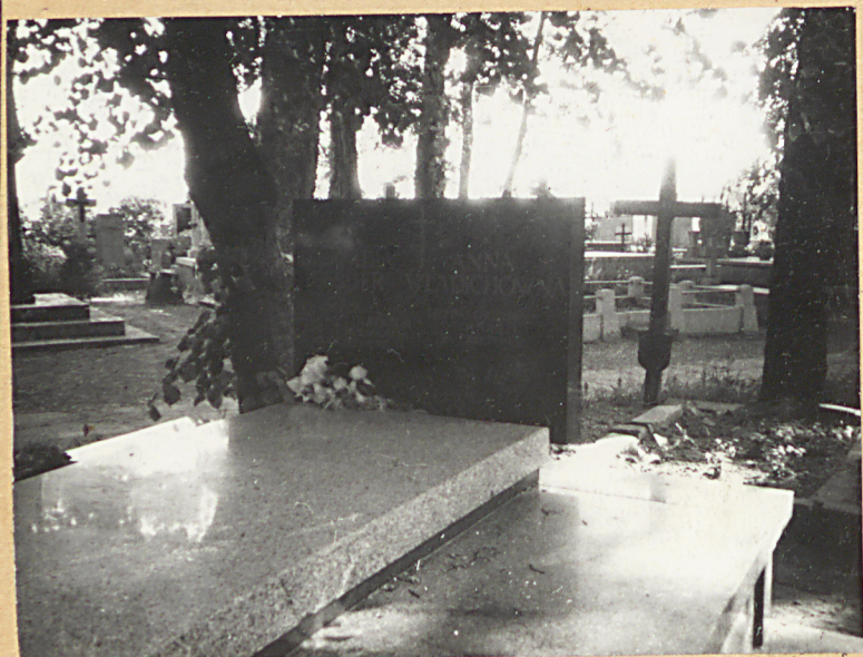
FOT.3 - NAGROBEK LEOKADII BERGER ZAŁOŻYCIELKI SZKOŁY ROLNICZEJ W TRZĘPOWIE