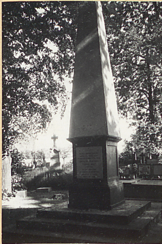
FOT.2 - POMNIK KUCZKI POLEGŁYCH W OBRONIE OJCZYZNY W LATACH 1918-1920