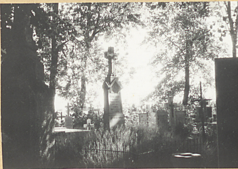
FOT.4. - STARE NAGROBKI W ZACHODNIEJ CZĘŚCI CMENTARZA