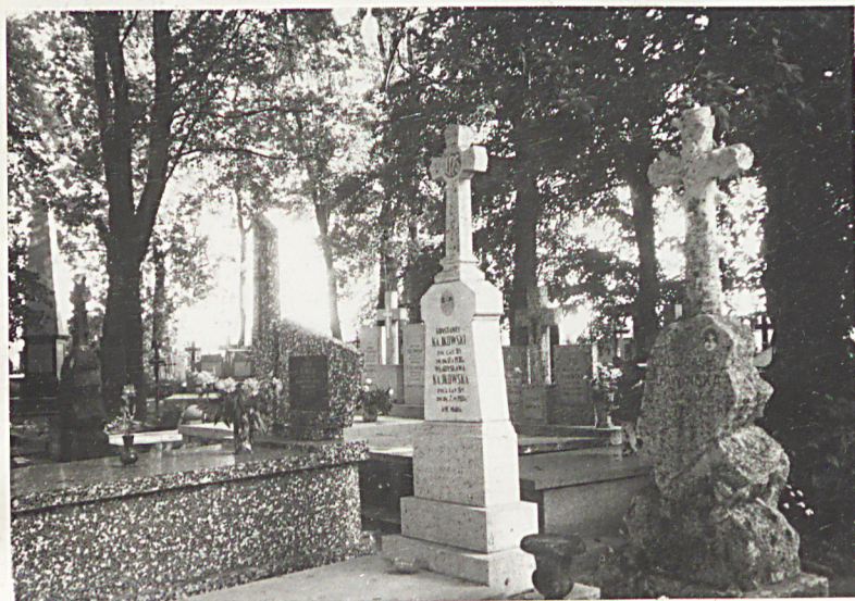
FOT.5 - STARE NAGROBKI W ZACHOD- NIEJ CZĘŚCI CMENTARZA