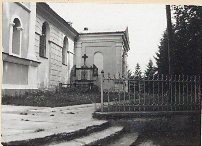
2. Południowa część cmentarza przykościelnego z nagrobkiem Iłatowickich