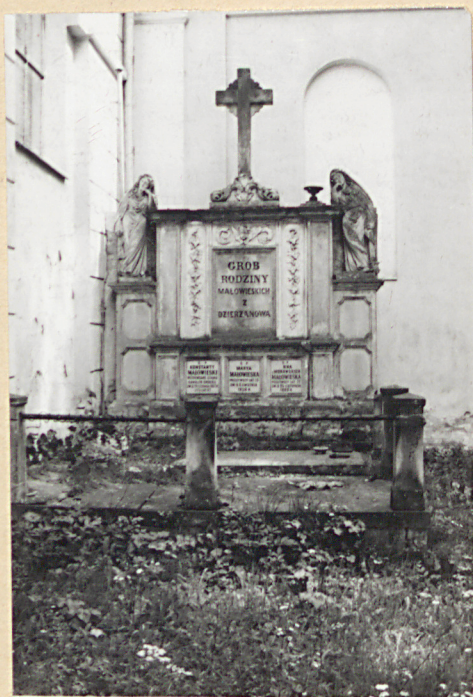
3. Grób rodziny Iłatowickich z Dzierżanowa z 4 ćw. XIX.