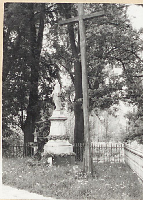
4. Figura MB i Krzyż misyjny w południowo-zach. części cmentarza