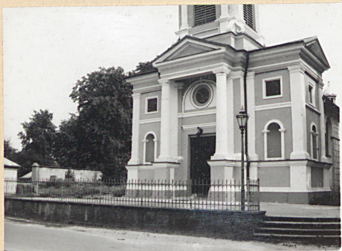
1. Kościół p.w. św. Floriana, ogrodzenie i wejście od strony południowo-zachodniej na teren cmentarza