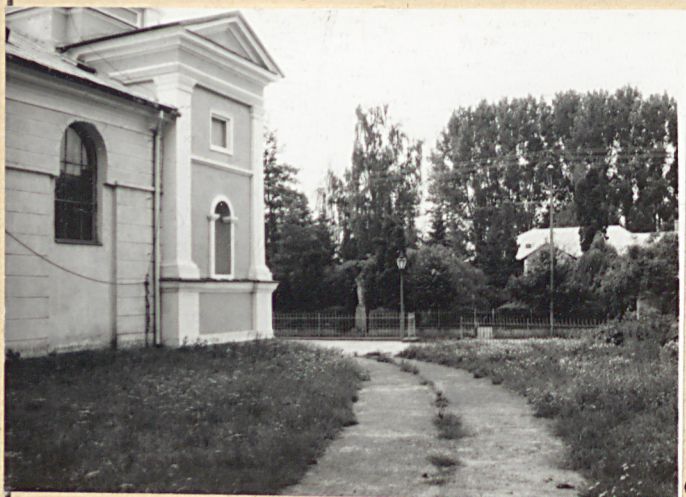
5. Południowo-wsch. część cmentarza przykościelnego