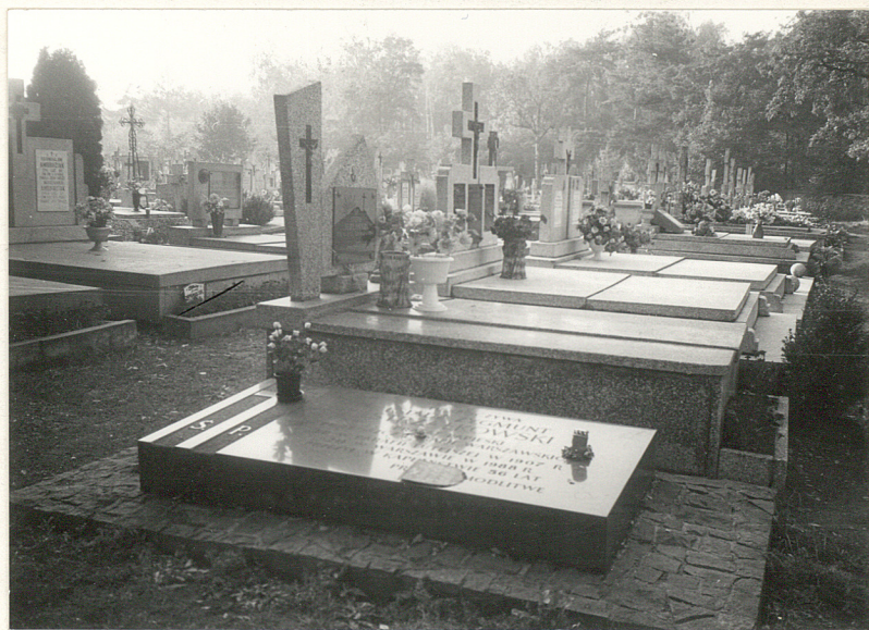
Fot. 4 - Nagrobek parafy Strzałkowskiego zm. 1988 r.