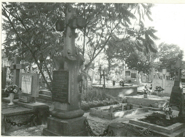
Fot. 6 - Nagrobek Guzowskiego zm. 1920r.