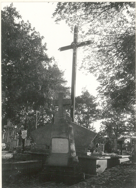
Fot. 3 - Krzyż cmentarny