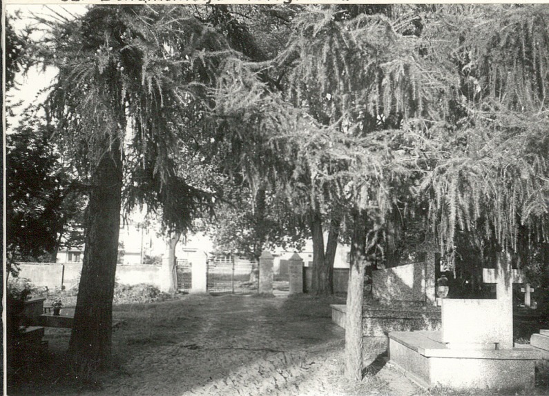
Fot. 1 - Brama i ogrodzenie