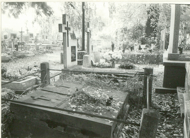
Fot. 5 - Płyty nagrobne z ok. 1920r.