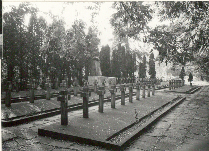
Fot. 2 - Kwatera żołnierska z 1939 r.