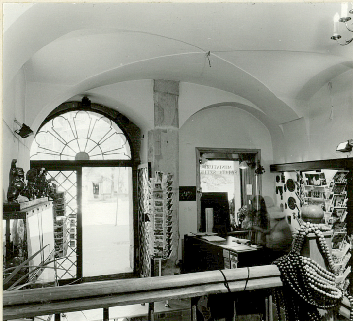
frontowe pomieszczenie parteru

Wkładkę założył: Waldemar Komorowski, Iwona Kęder (imię, nazwisko, data)