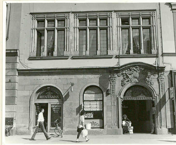
dolna partia fasady