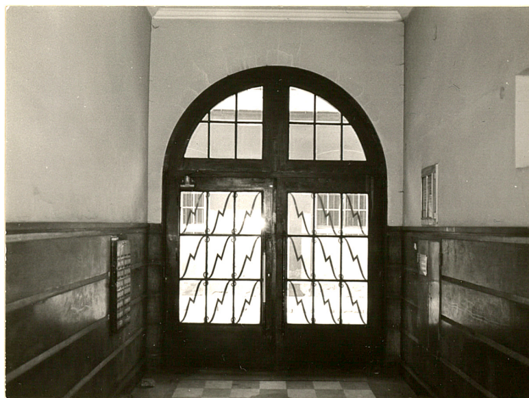
Sień - brama wejściowa

wodno-kanaliz., elektryczna, gazowa, co.