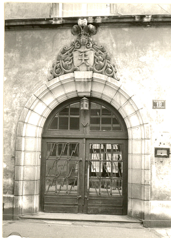
Portal - elewacja frontowa

OZGraf. Z.P. Ostróda zam. 699 nakł. 23.600