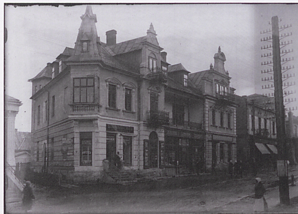
widok od strony ul. Krupówki

Wkładkę założył: mgr inż. arch. Oskar Huniak 2017 r.