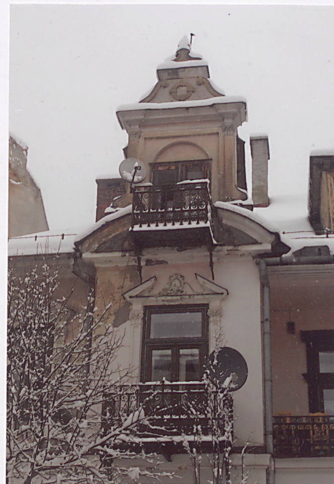
lukarna, widok od strony ul. Krupówki