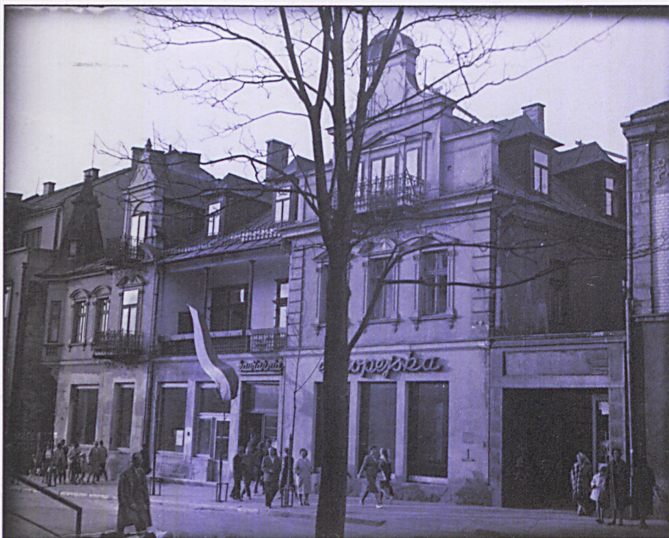
widok od strony ul. Krupówki