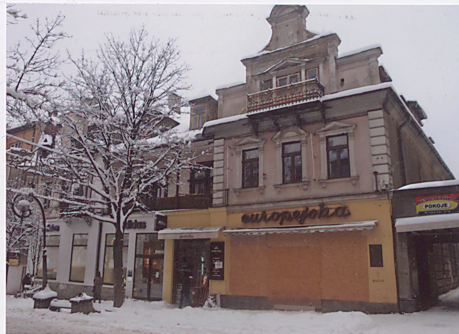
widok od strony ul. Krupówki