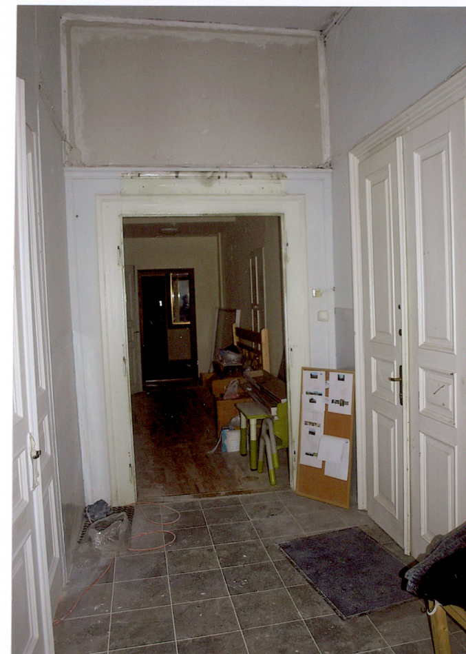
korytarz na piętrze