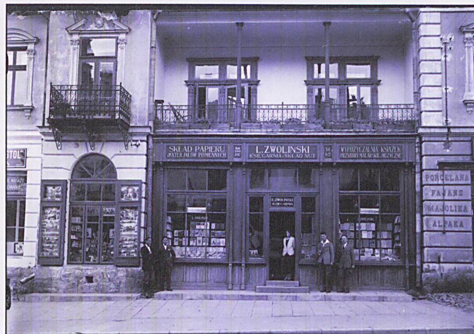
widok od strony ul. Krupówki