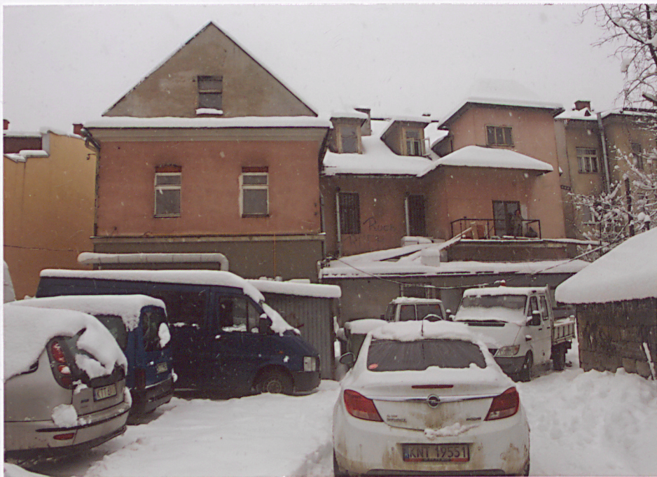
widok od strony podwórza