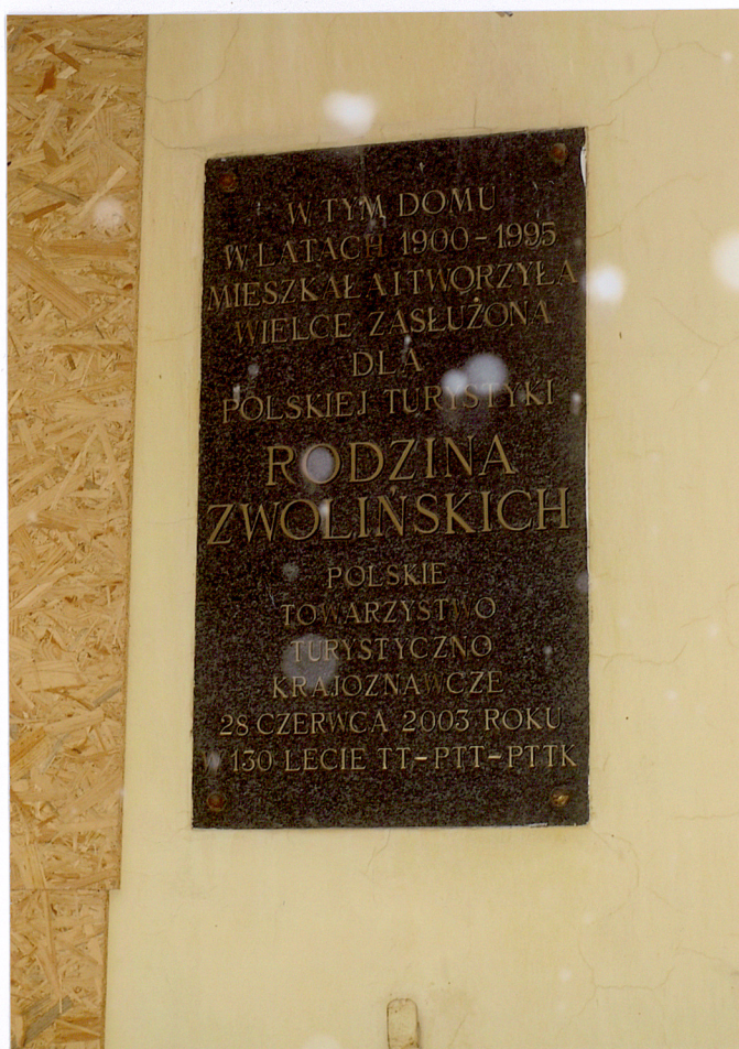
tablica pamiątkowa na elewacji