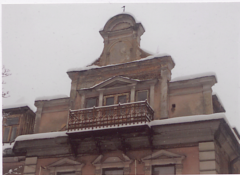
lukarna, widok od strony ul. Krupówki