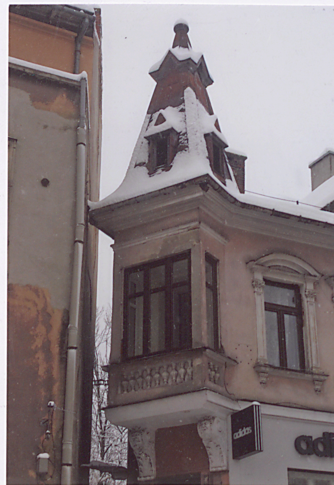
widok naroża od strony ul. Krupówki