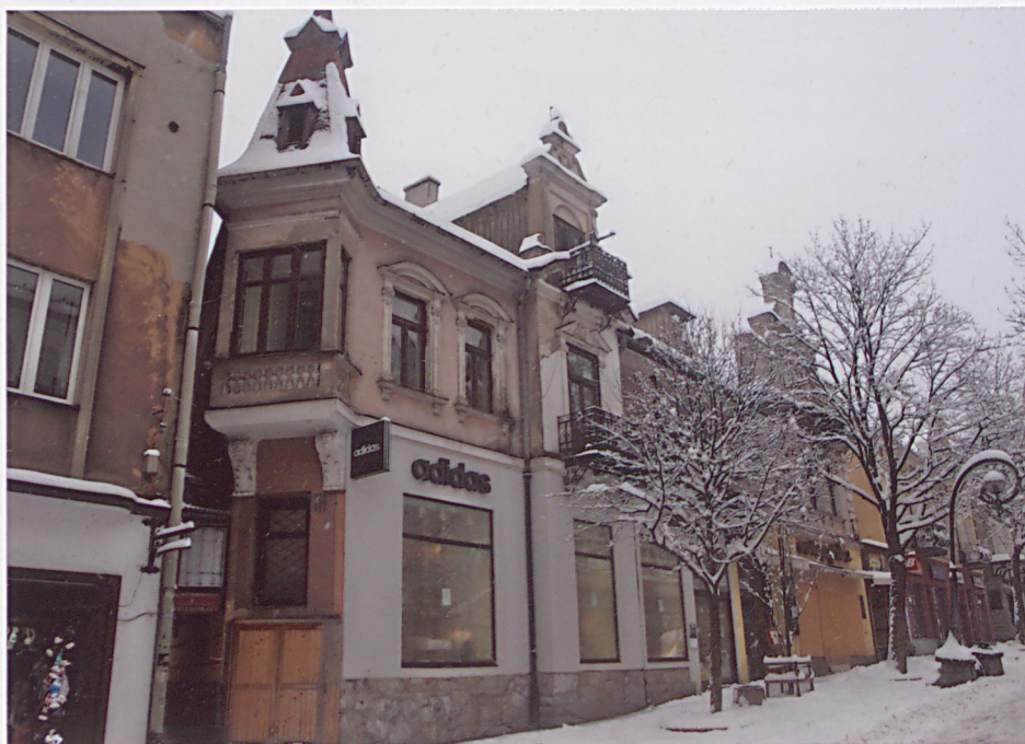
widok od strony ul. Krupówki