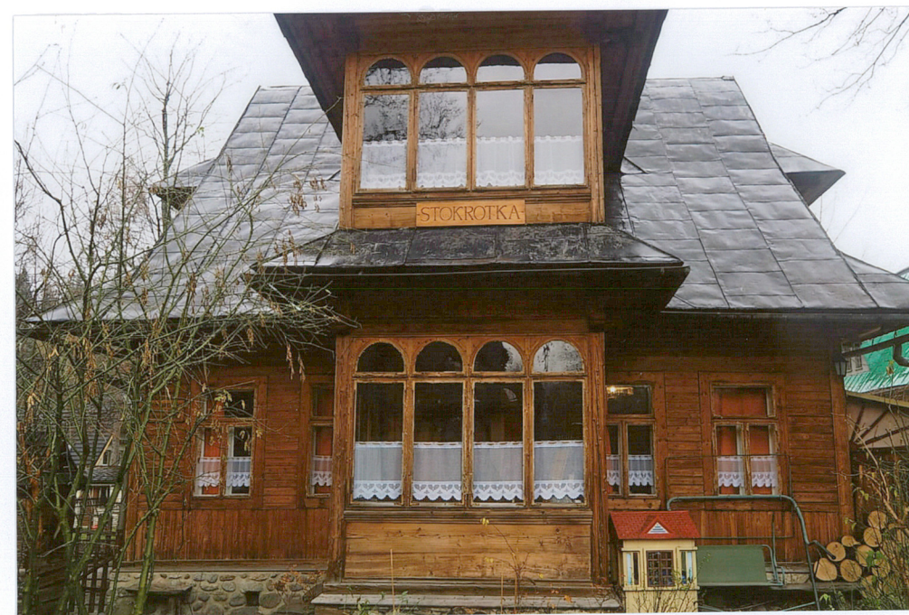
ganek z werandą przy elewacji frontowej