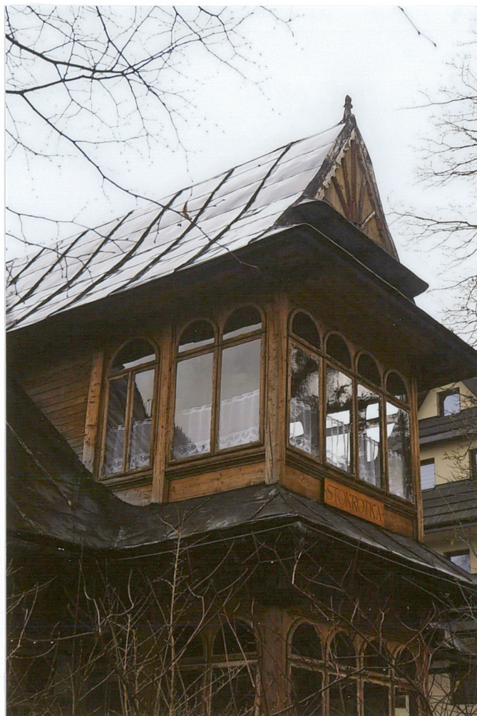
ganek z werandą przy elewacji frontowej