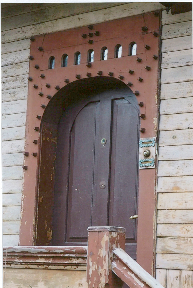
odrzwia w elewacji zachodniej