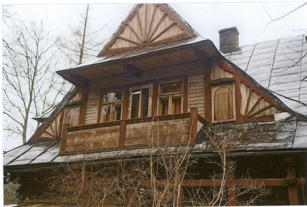
balkon w szczycie elewacji wschodniej