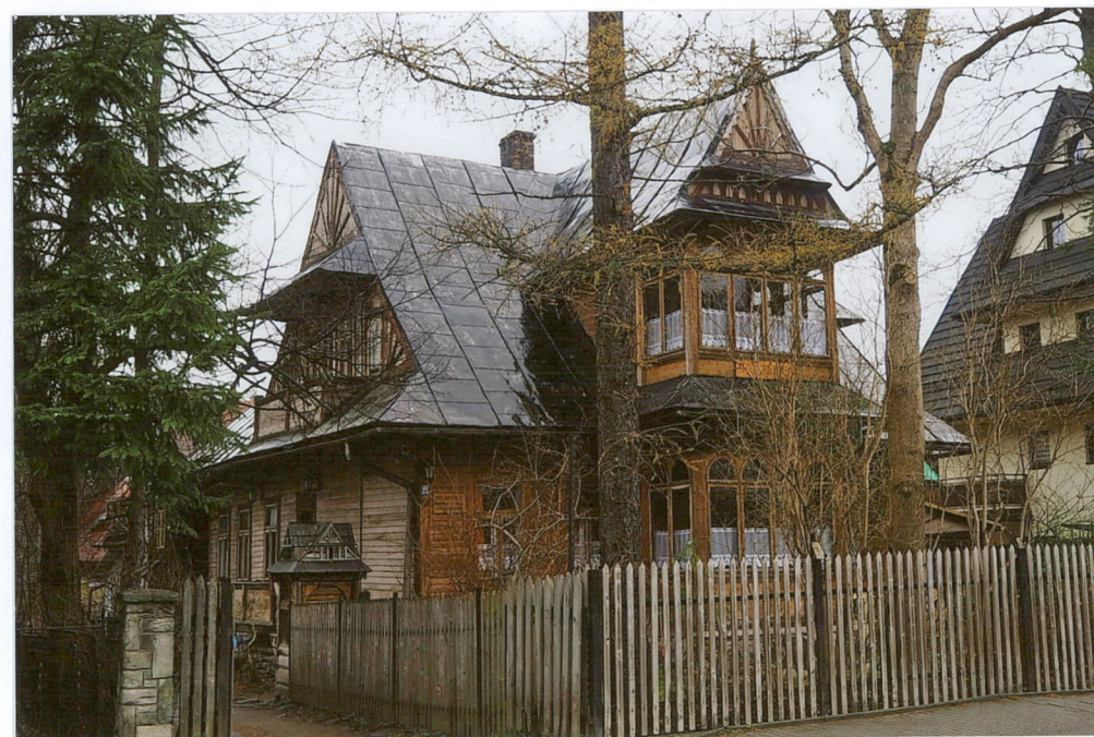
widok od południowego - wschodu