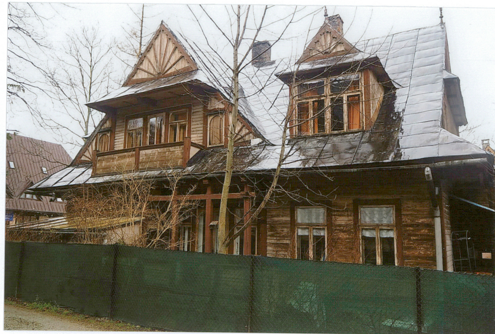
widok od wschodu widok na elewację północną