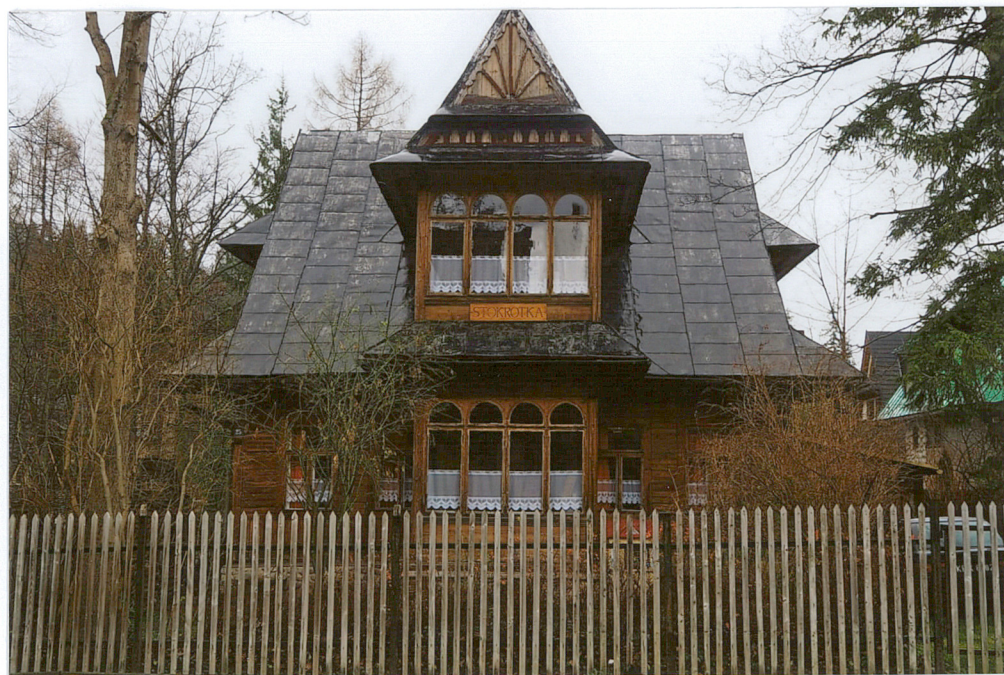
widok od południa