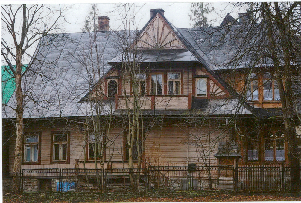
widok od zachodu elewacja wschodnia