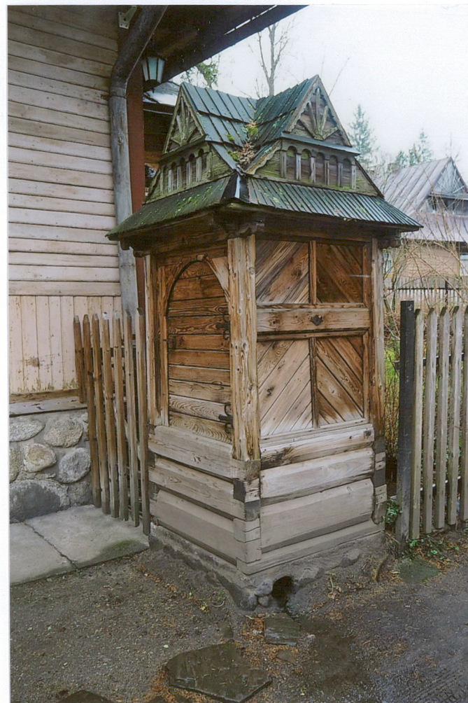
zabytkowa obudowa studni