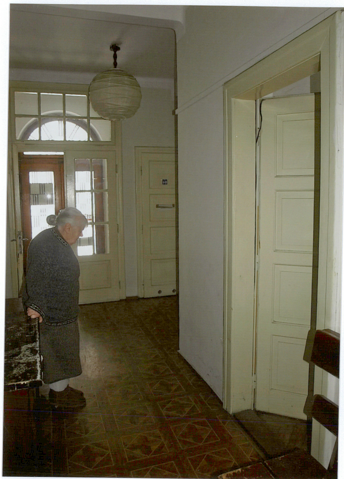
hol główny willi