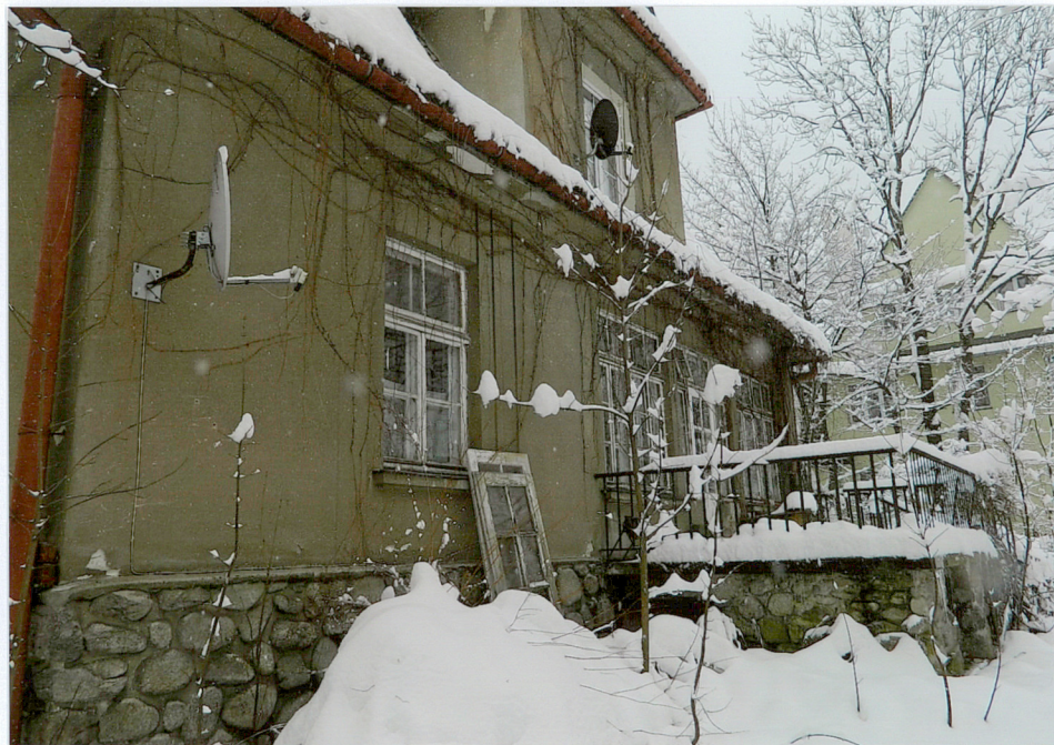
widok od strony północno - zachodniej