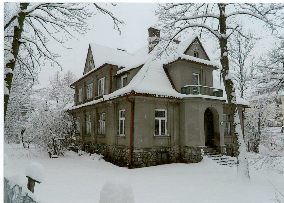
widok od strony południowo - wschodniej

Wkładkę założył: mgr inż. arch. Oskar Huniak 2017 r.