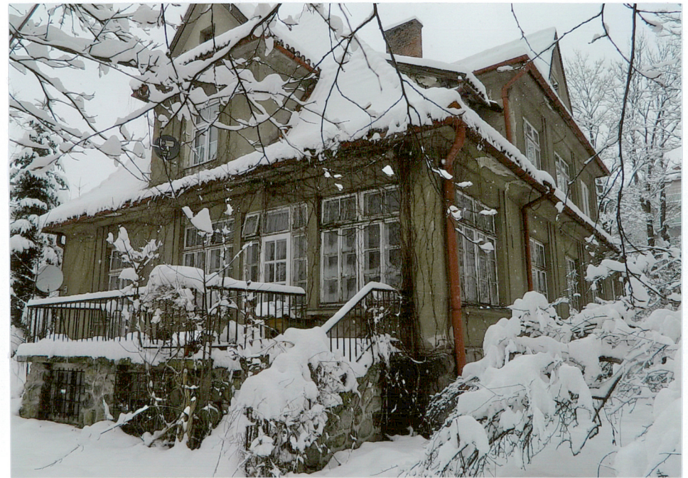
widok od strony południowo - zachodniej