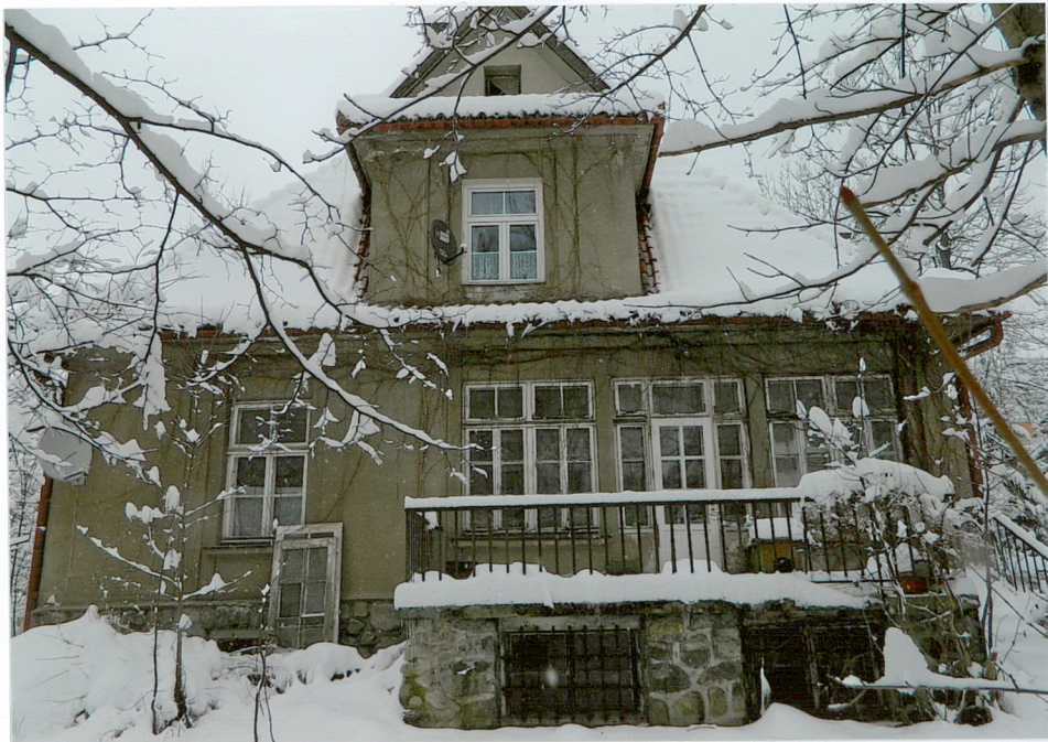
widok od strony zachodniej