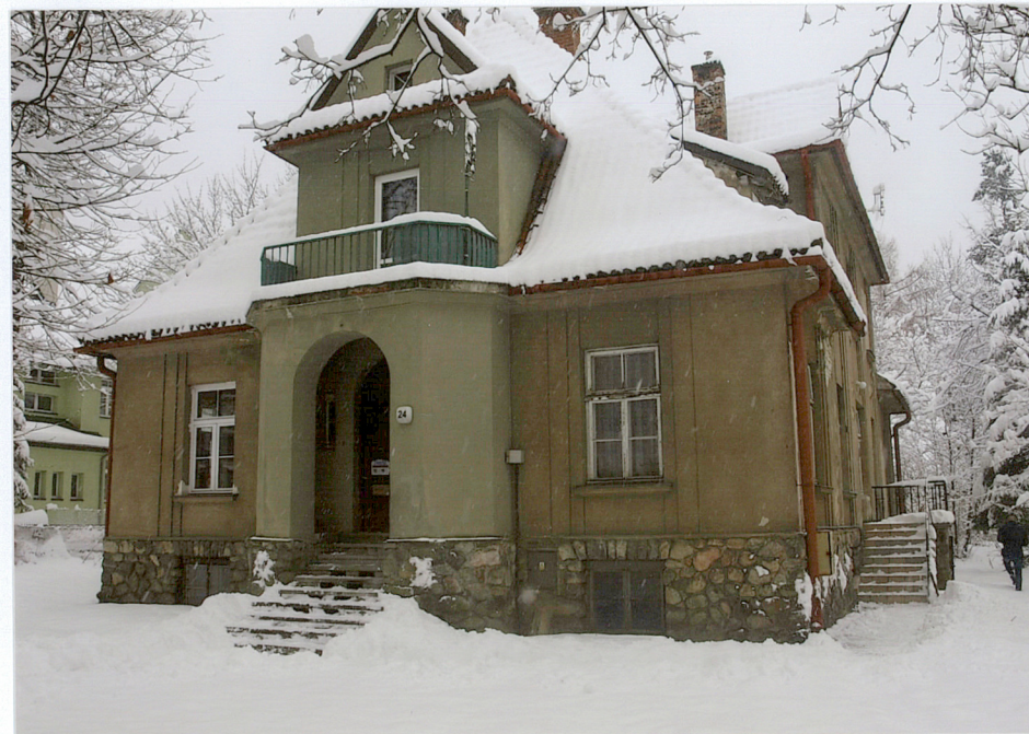
widok od strony północno - wschodniej

Wkładkę założył: mgr inż. arch. Oskar Huniak 2017 r.