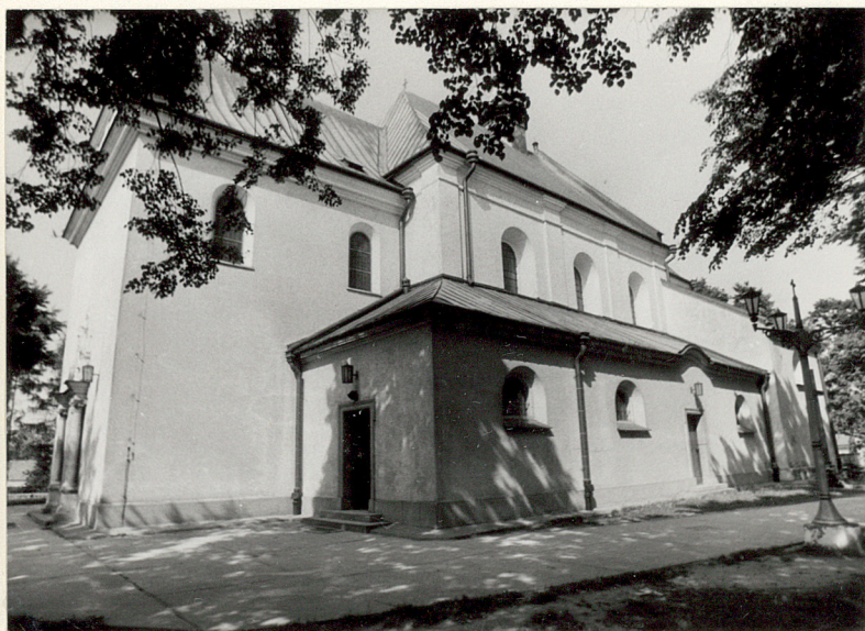
widok od południa