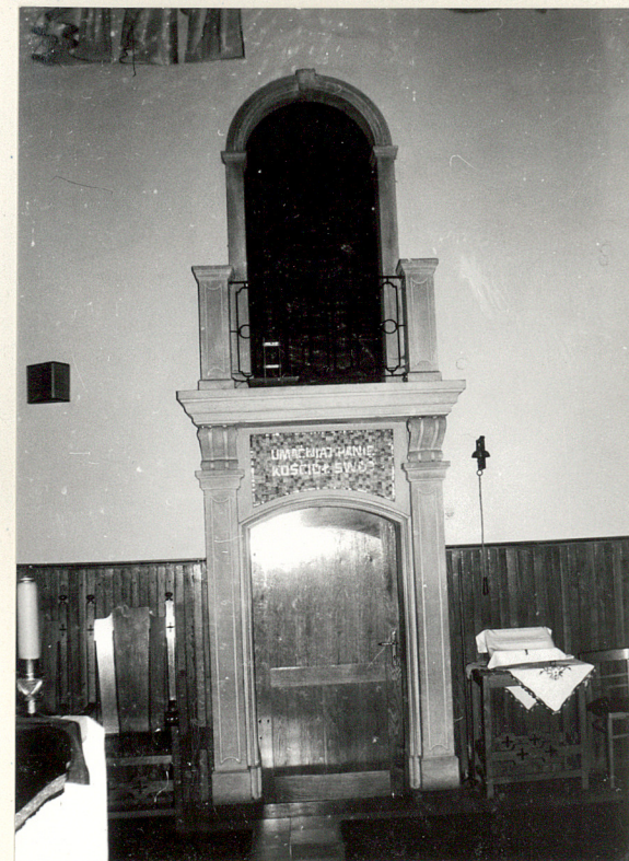
portal wejścia do zakrystii / na piętrze balkon skarbczyka /