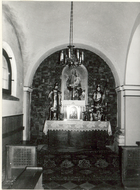
ołtarz w nawie bocznej / północnej /