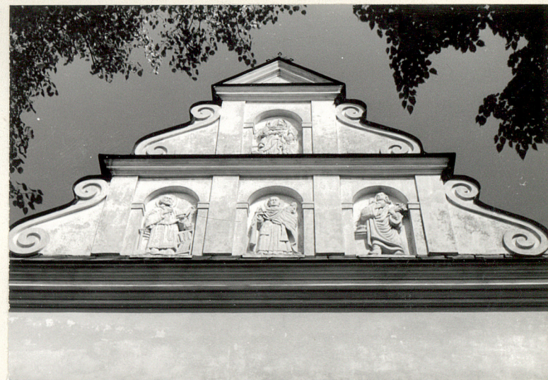
renesansowy szczyt fasady frontowej