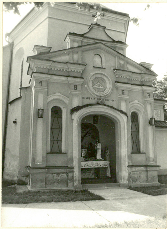
Ogrojec w zamknięciu prezbiterium