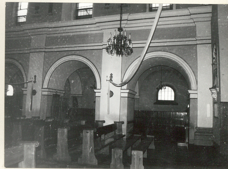
arkadowe przejścia z nawy głównej do bocznej północnej