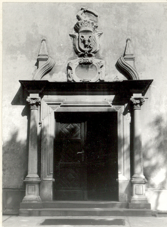
barokowy portal z 1684 w elewacji frontowej