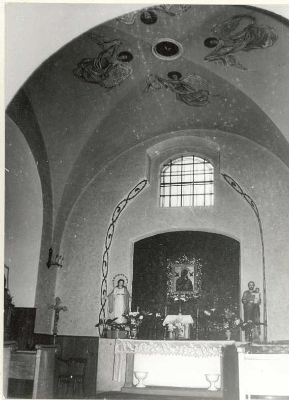
ołtarz w kaplicy / przy nawie bocznej - południowej /