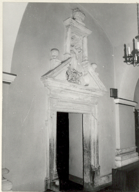
portal z rzeźbą NMP na smoku w przejściu z nawy południowej d głównej / XVII w., barokowy /