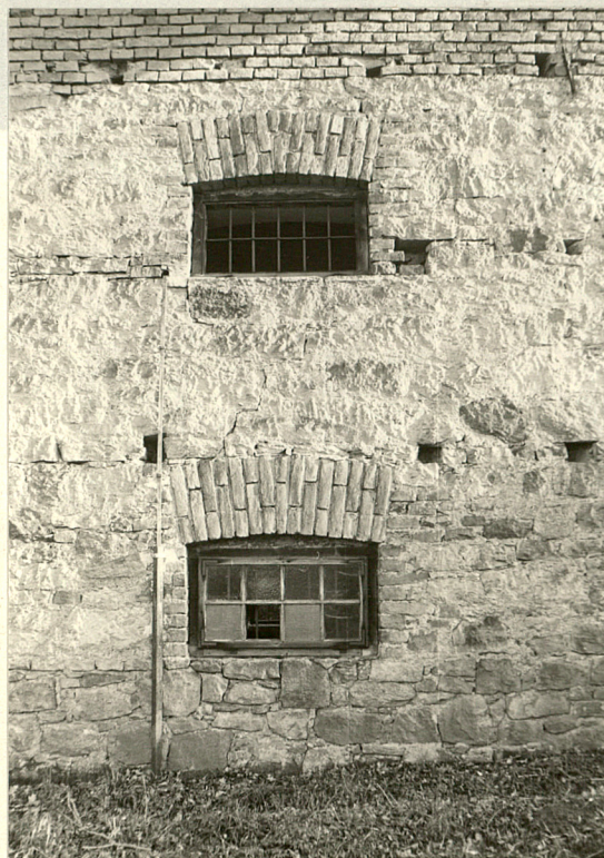
Okna w elewacji zachodniej