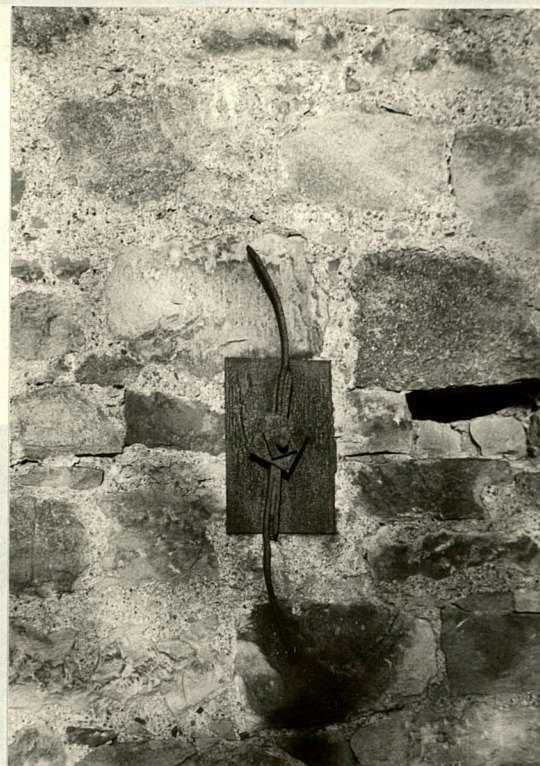
Kotwy ścąg w ścianie szczytowej od południa