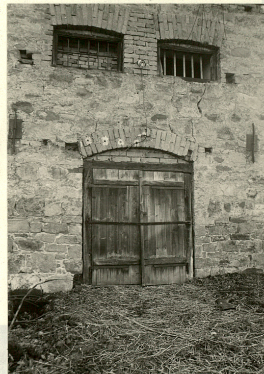
Północna ściana szczytowa