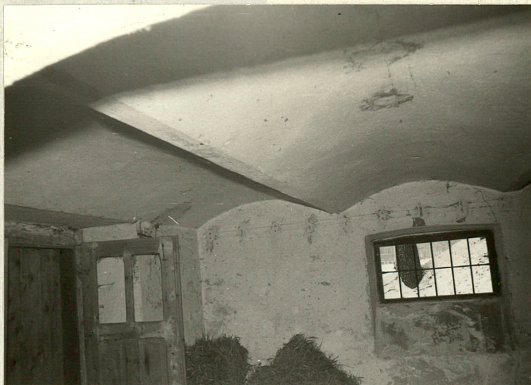
Sklepienie w parterze