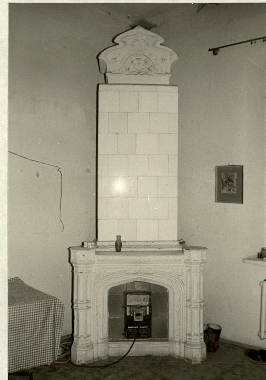
Piec eklektyczny z białych kafli