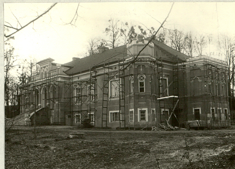
Widok od północnego-zachodu