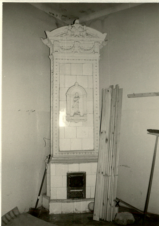
Piec eklektyczno-barokowy z białych kafli