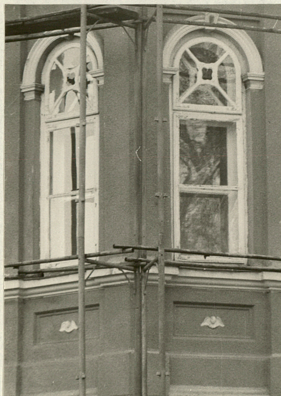
Okna w baszele