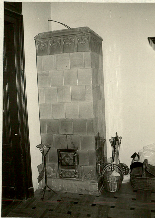
Piec secesyjny z zielonych kafli