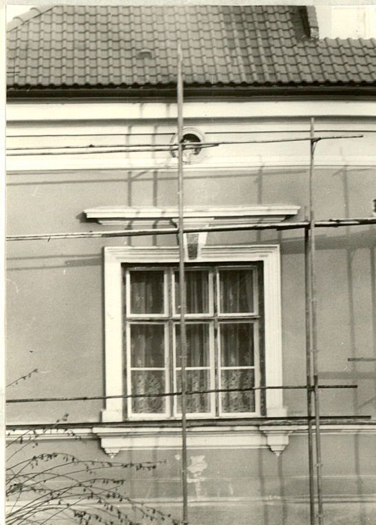
Okno w ryzalicie elewacji południowej