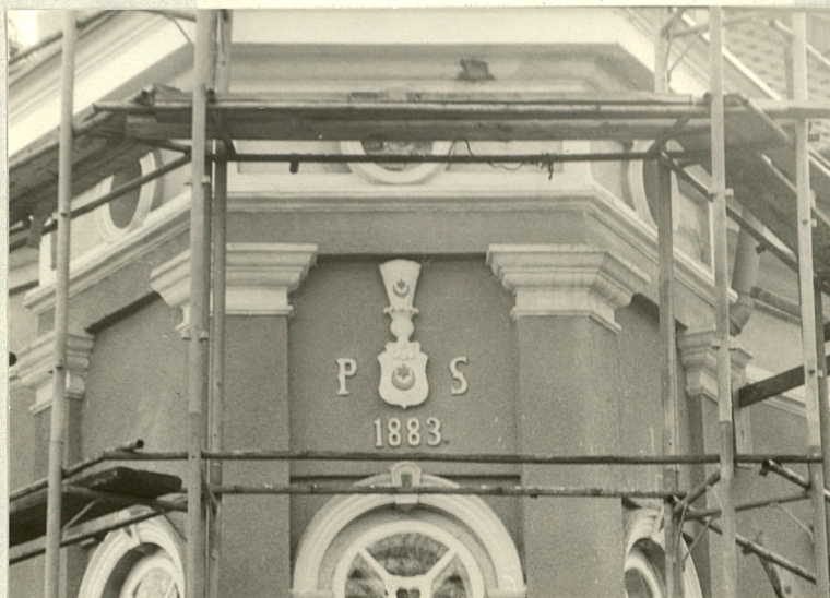
Kartusz herbowy w baszcie

3. Zawartość wkładki (nazwa obiektu lub materiału uzupełniającego) Fotografie dodatkowe