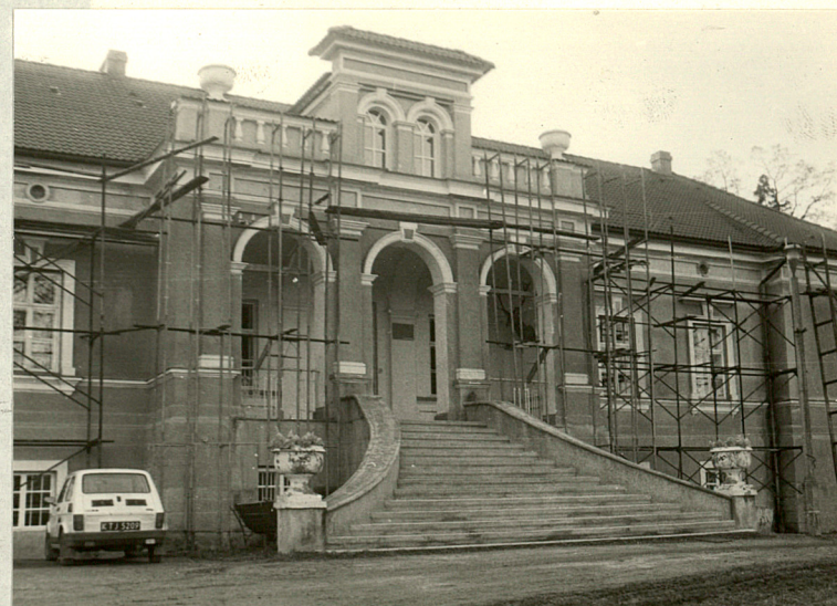
Loggia od północy z wejściem głównym