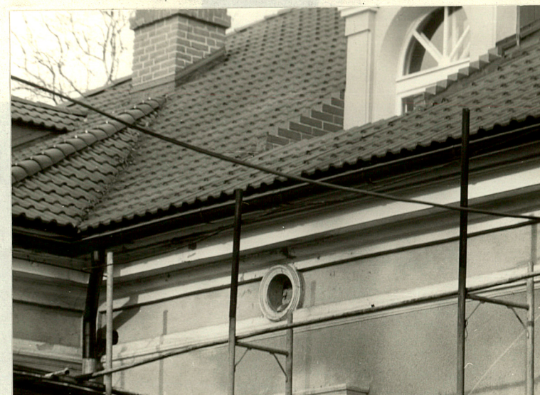
Gzyms w elewacji południowej