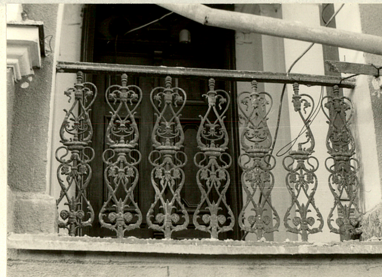
Balustrada loggi od wschodu