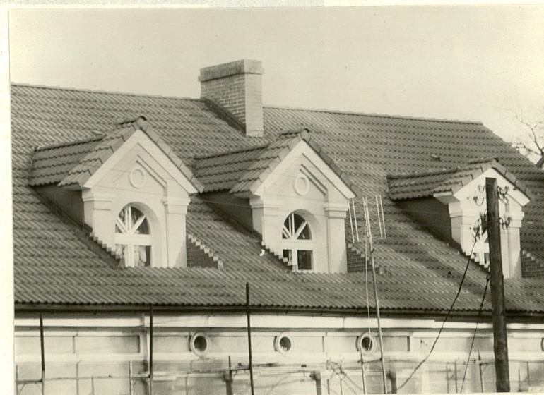
Facjaty w dachu od południa