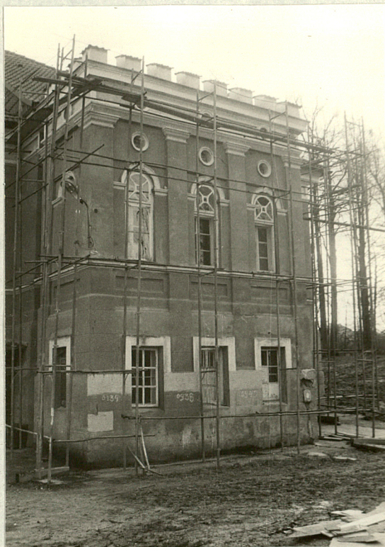
Ryzalit w elewacji zachodniej