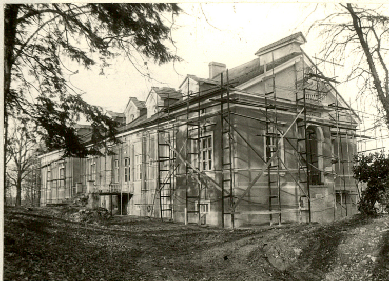
Widok od południowego-wschodu

3. Zawartość wkładki (nazwa obiektu lub materiału uzupełniającego) c.d.punktu 13 + fotografie dodatkowe