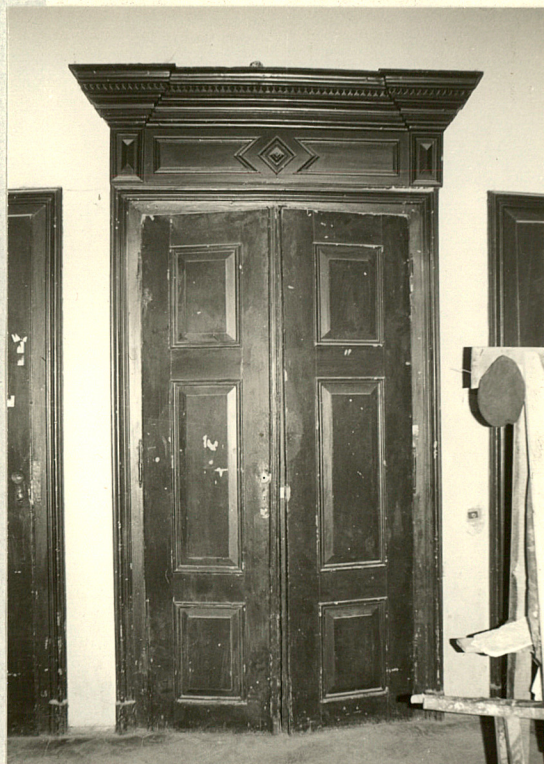
Drzwi w sali na parterze