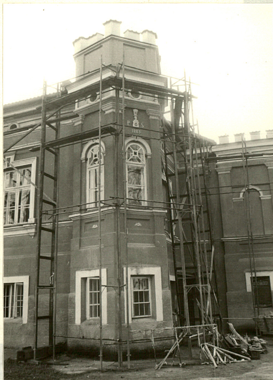
Baszta w narożniku płn.-zach.