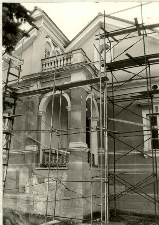
Loggia w elewacji wschodniej