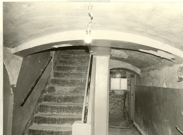
Schody w zachodniej części suterenu