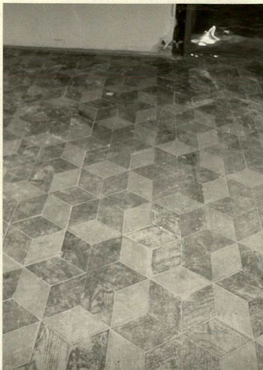
Fragment mozaiki parkietowej w jednym z pokoi na parterze. Mozaika z ok. 1888 r.