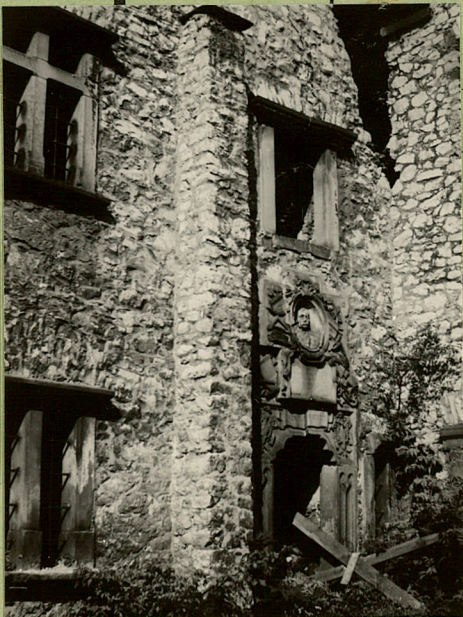
FOT. 1967 (2)