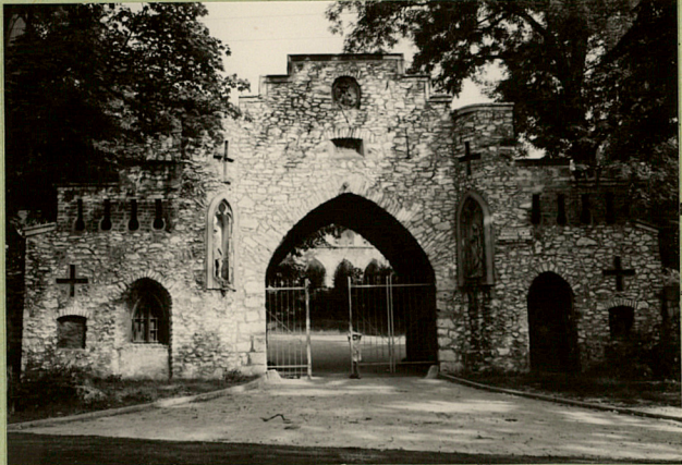
FOT. 1967 (2)