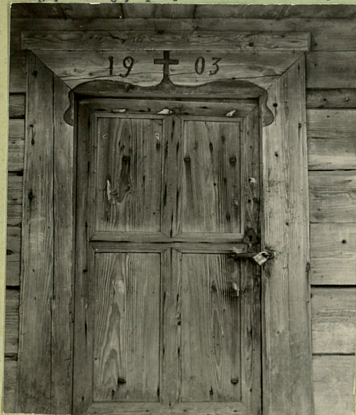
Sytuacja w karcie plebanii.

kowane, tylny listwowany. Szczyt frontowy znacznie nadwiesz- ny na przedłużonych płatwiach dolnych. Wejście przez portal drewniany, prostokątny o ozdobnie płaskorzeźbionym nadprożu /fot/ z wrytą datą budowy. Drzwi płycinowe. Wewnątrz strop na fazowanych tragarzach założonych poprzecznie. W tylnej ścianie okienko z kratą wiązana, kutą. W drzwiach skobel żelazny, kuty, pięknie zdobiony.