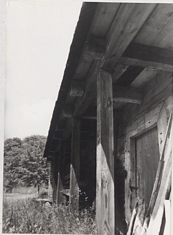
podcień elewacji frontowej / płd./