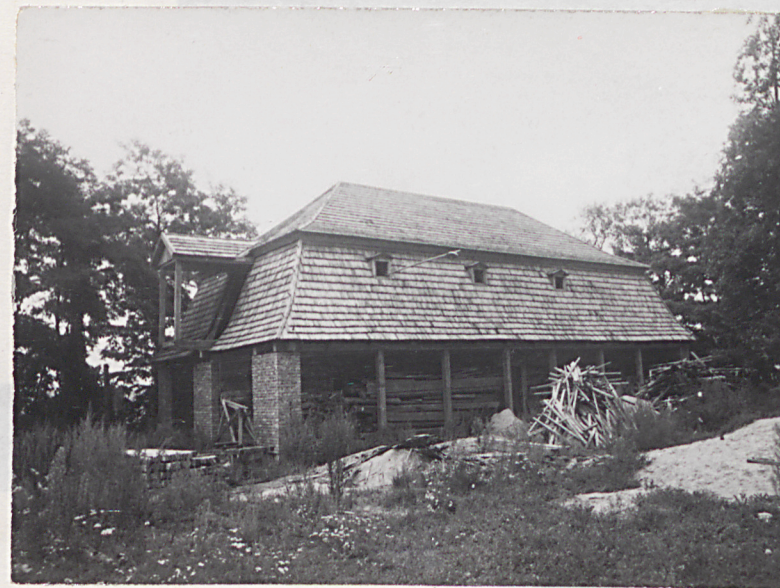
stan z 1983 r.