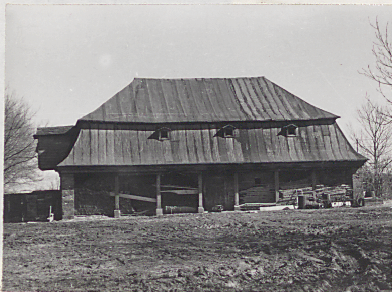
spichlerz przed przeniesieniem / ok. 1978 r. /