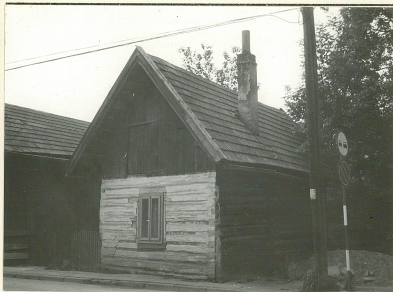
1. Widok ogólny