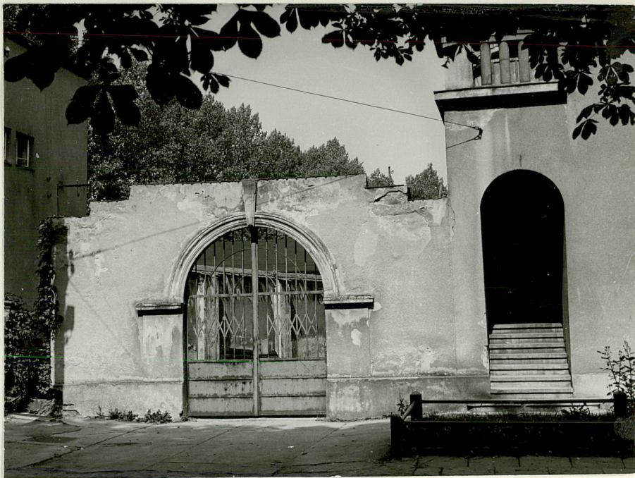
Fotografia dodatkowa: bramka w murze, fot. T. Kalarus, neg. PKZ Kraków, 24567/A.