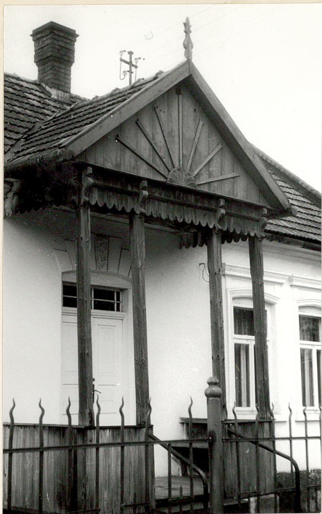
Zdjęcie dodatkowe: ganek w fasadzie, fot. Z. Beiersdorf, listopad 1979.