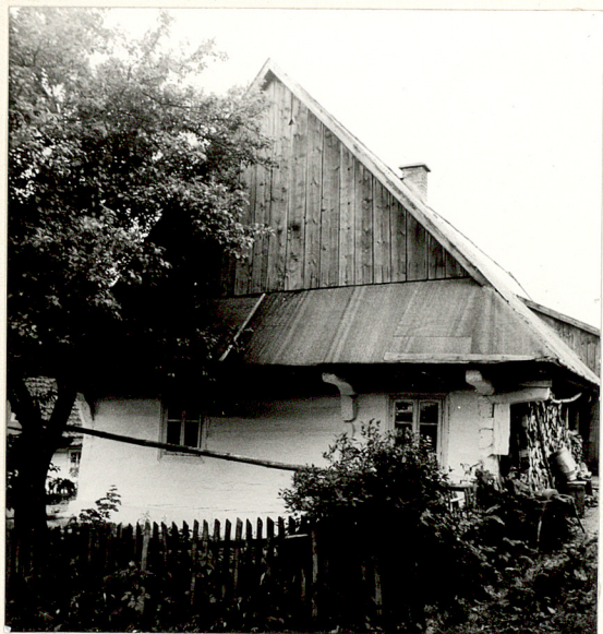
B A R T N E - chałupa w zagrodzie nr 1 - zdjęcia dodatkowe