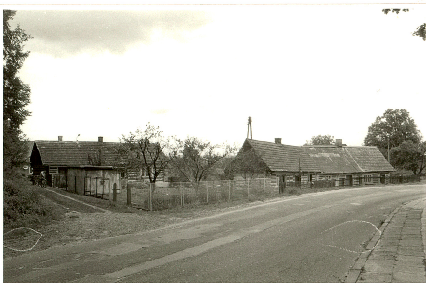
Drewniane domy nr 139, 137, 145 i 149