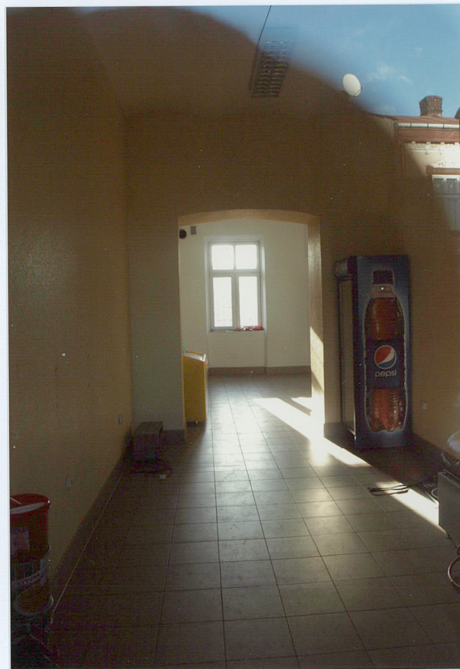
wnętrze lokalu handlowego