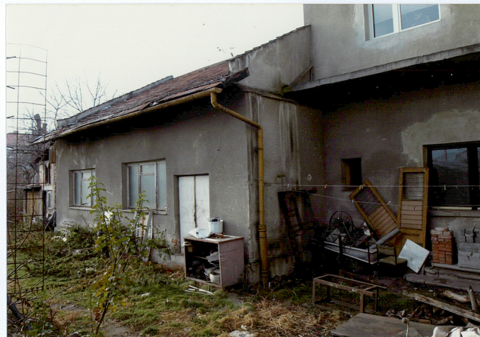
elewacje przybudówek od podwórza