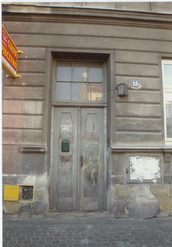
brama w fasadzie od ul. Grodzkiej