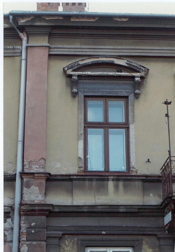
detal architektoniczny okien