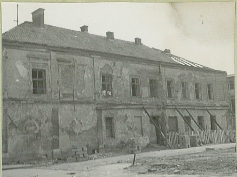
32. Przebieg prac konserwatorskich