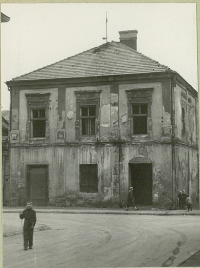
31. Szkic sytuacyjny, plan schematyczny, uwagi opisowe, fotografia

Z Y X W V U T S R P O N M L K J I H G F E D C B A Nr