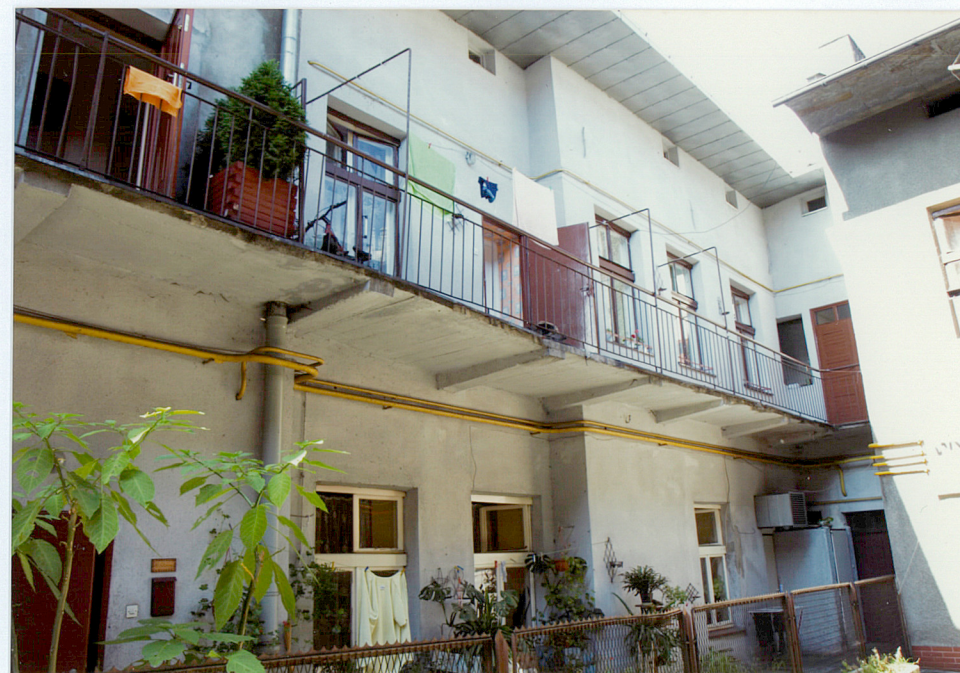
elevacje od podwórza