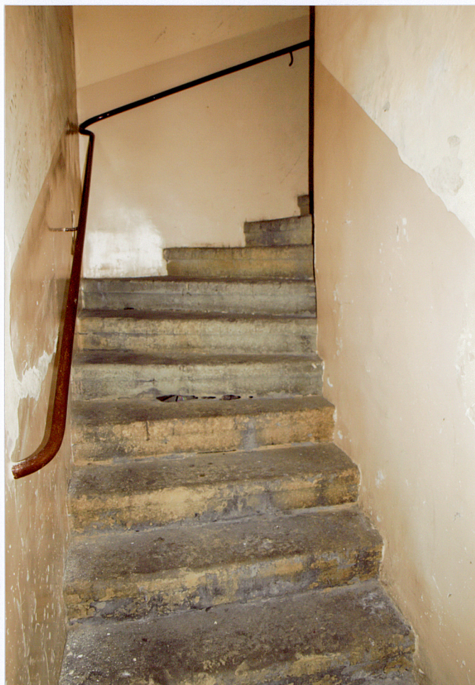
klatka schodowa na piętro