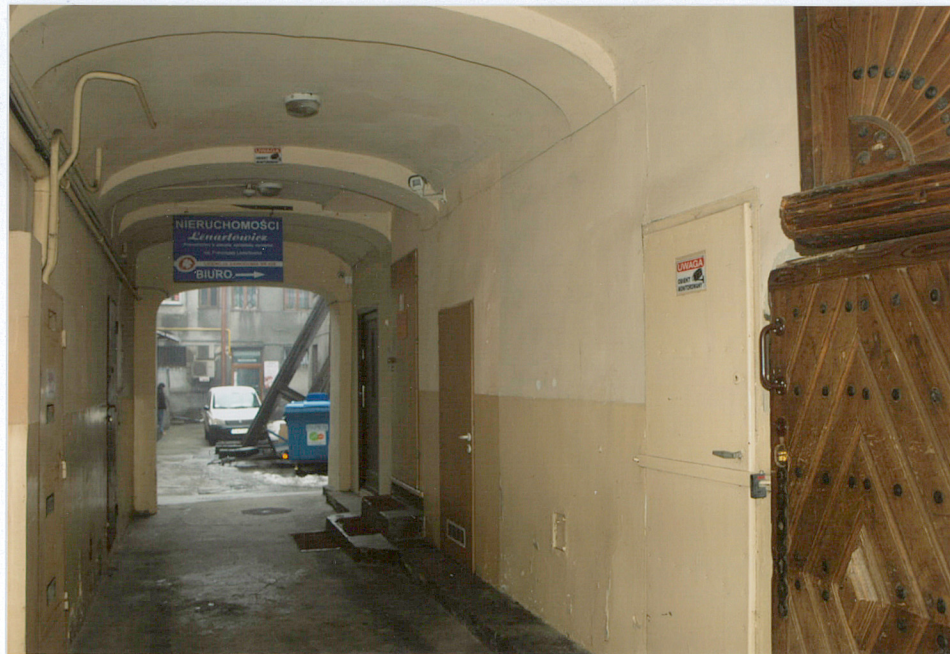
brama i sień budynku