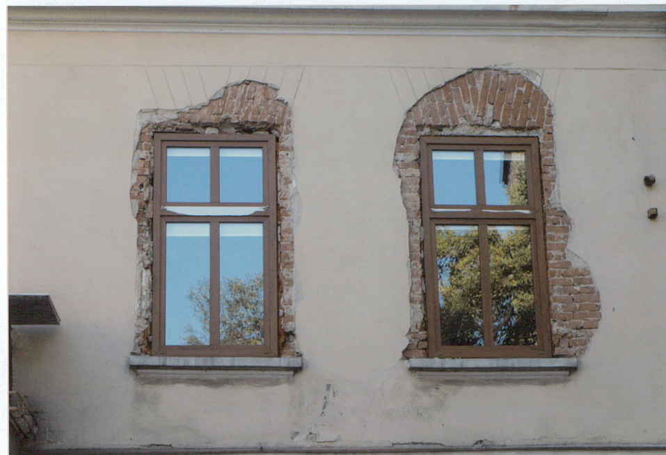
otwory okienne elewacji frontowej