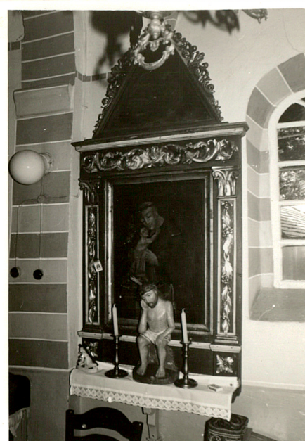
ołtarzyk boczny / prawy /