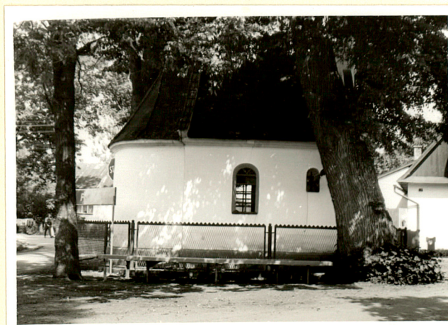
widok od zachodu