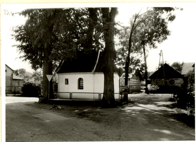
widok od wschodu

Krucyfiks barokowo-ludowy, z XIX w. Krzyże ołtarzowe / 2 / malowane, barokowo-klasycystyczne z XIX w. Lichtarze drewniane, ludowe, malowane z XIX w. Na ścianie tablica epitafijna Stanisława Korcza. Kaplica posiada instalację elektryczną.