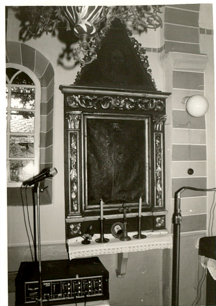
ołtarzyk boczny / lewy /