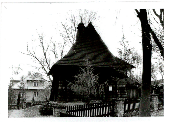
widok od zach.