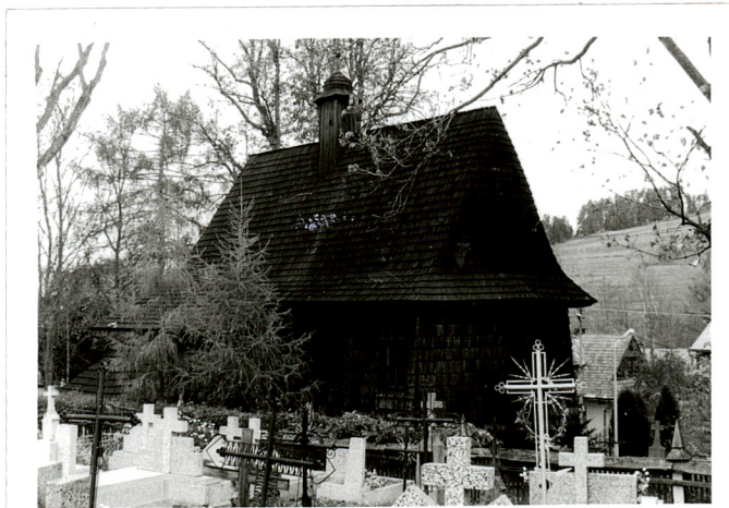
widok od płd-wsch.