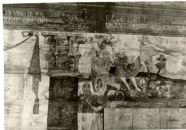
scena Chrystusa Triumfującego na rydwanie