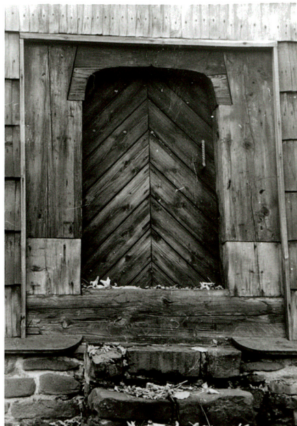
portal w fasadzie