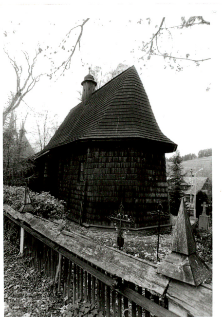
widok od wschodu