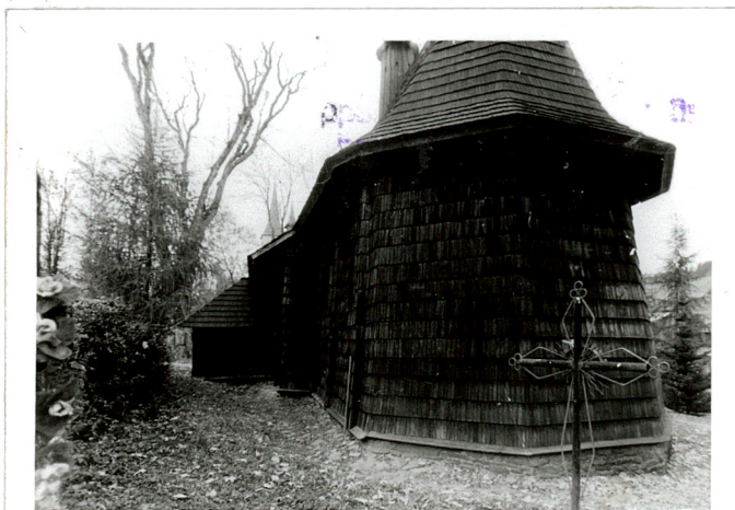
widok od wsch.

Wyposażenie wnętrza dopełniają : mensa ołtarzowa z ustawionym drewnianym tabernakulum i dwoma rokokowymi drewnianymi świecznikami oraz kilka barokowo-ludowych feretronów.