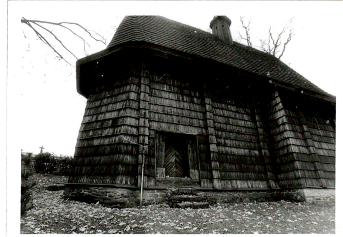
widok od północy