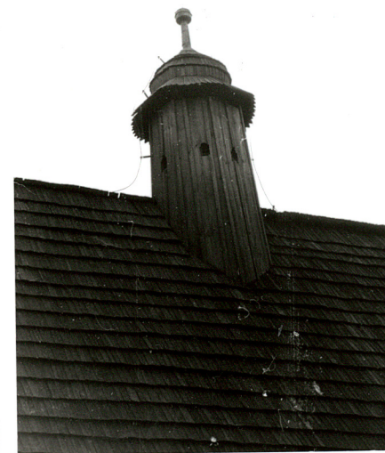
wieżyczka na sygnaturkę