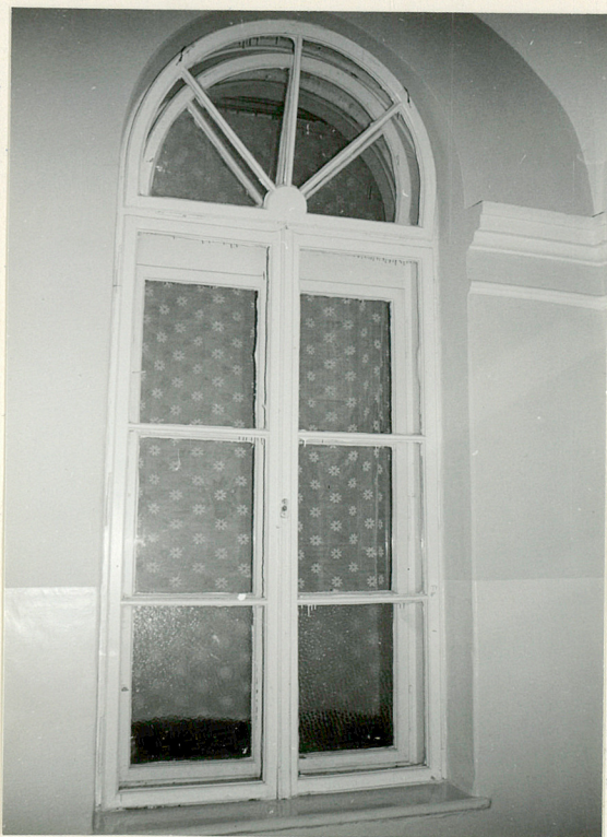
Okno w korytarzu na parterze