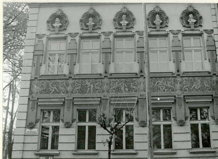
Południowy fragment fasady