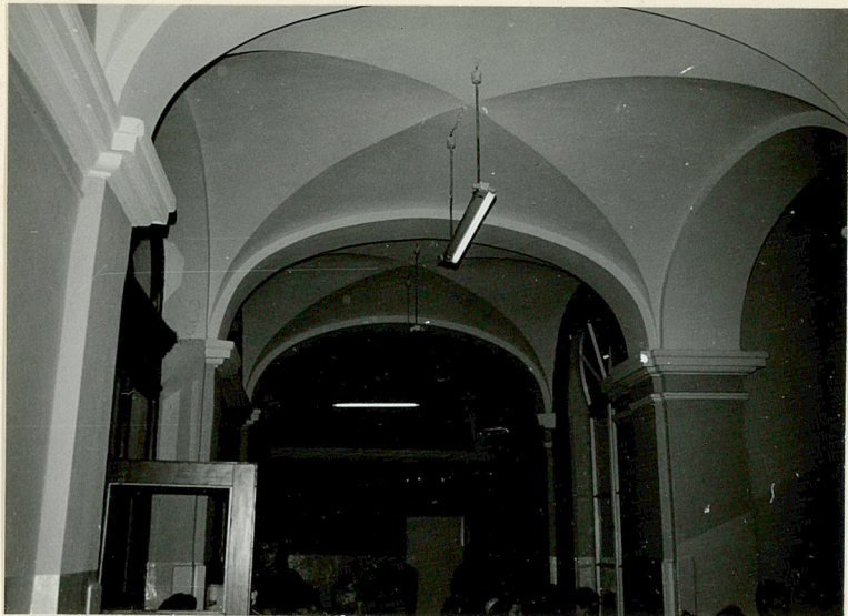
Sklepienie korytarza na parterze