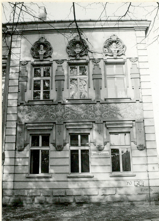
Wschodnia część elewacji pld.