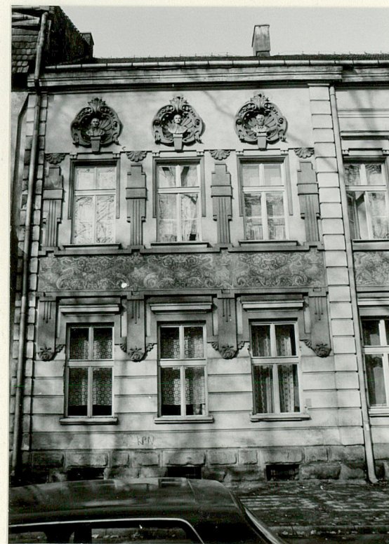
Zachodnia część elewacji południowej