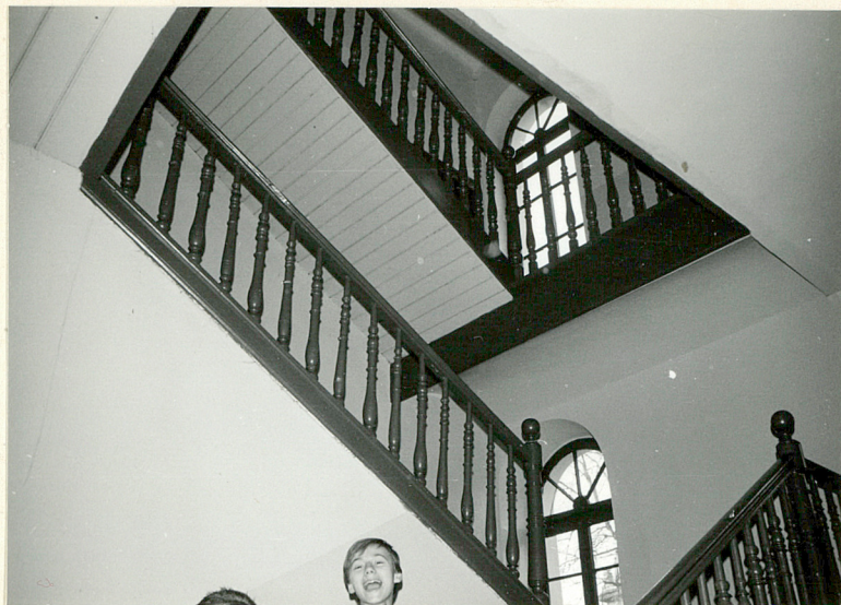
Klatka schodowa w skrzydle zachodnim

Fotografie dodatkowe + opis szkoły z kroniki szkolnej z 1898