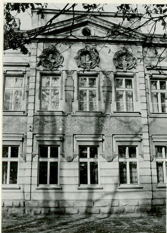
Środkowa część elewacji południowej