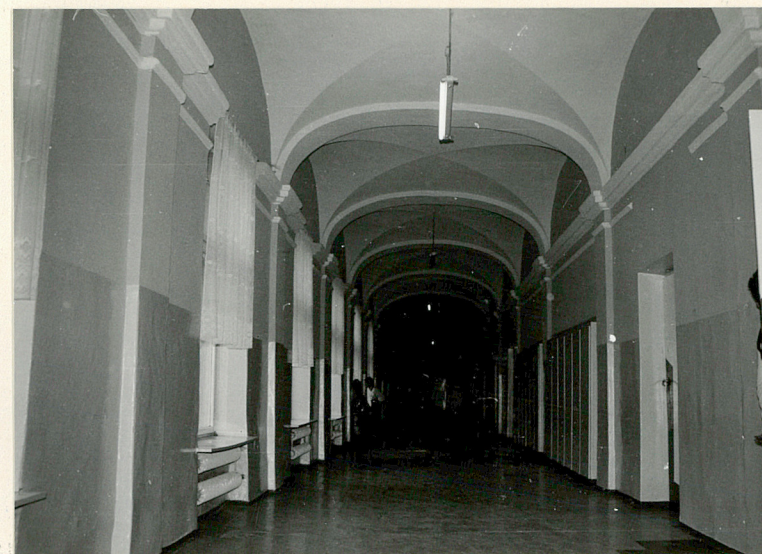
Korytarz na parterze