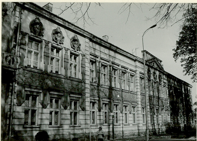
Elewacja południowa od zachodu