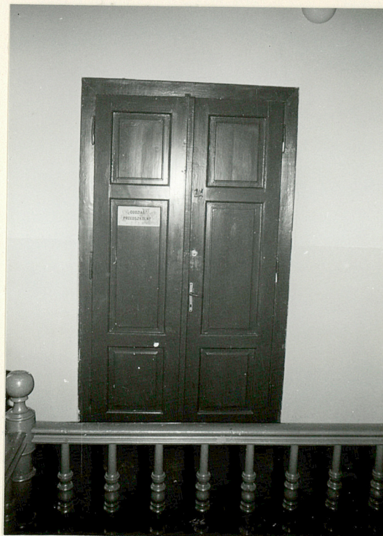
Drzwi do sali na piętrze