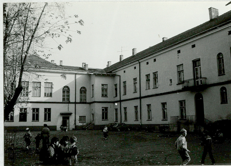
Widok od północno-zachodu

Instalacje. Obiekt posiada instalację elektryczną, wodno-kanalizacyjną, gazową i centralnego ogrzewania.