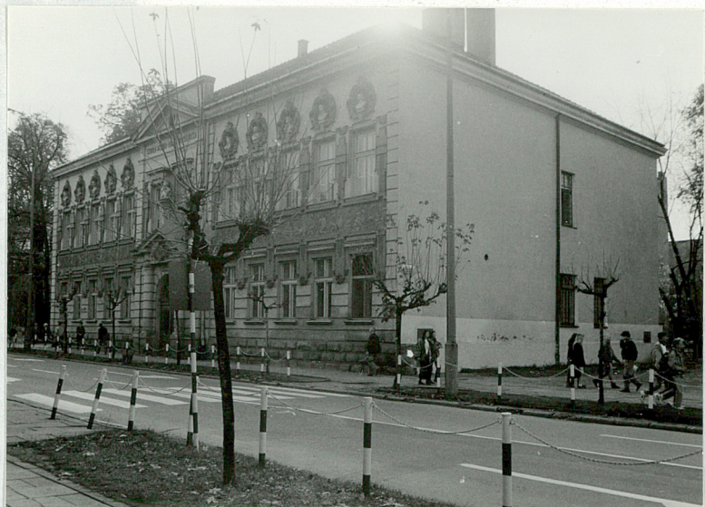
Widok od północnego-wschodu

3. Zawartość wkładki (nazwa obiektu lub materiału uzupełniającego) c.d. opisu + fotografie dodatkowe