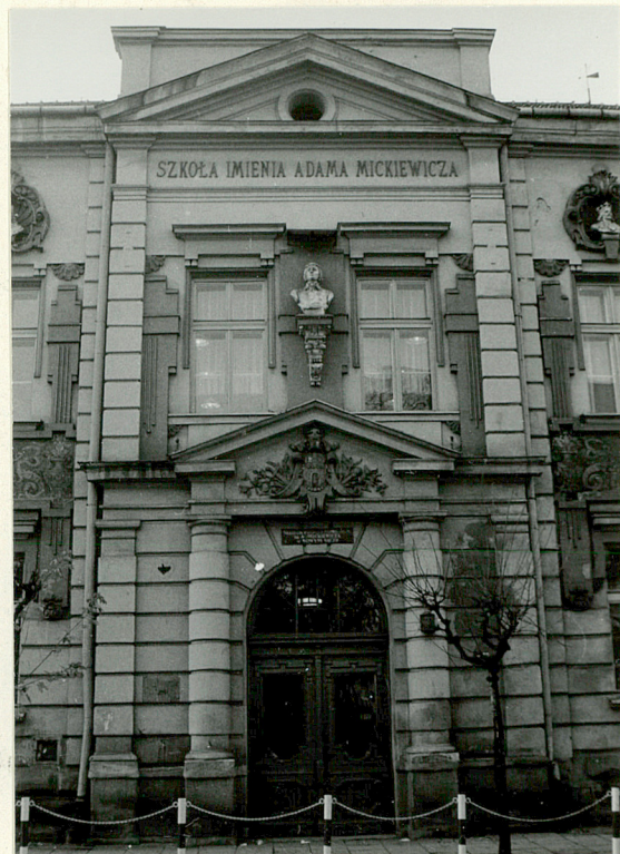
Środkowa część fasady