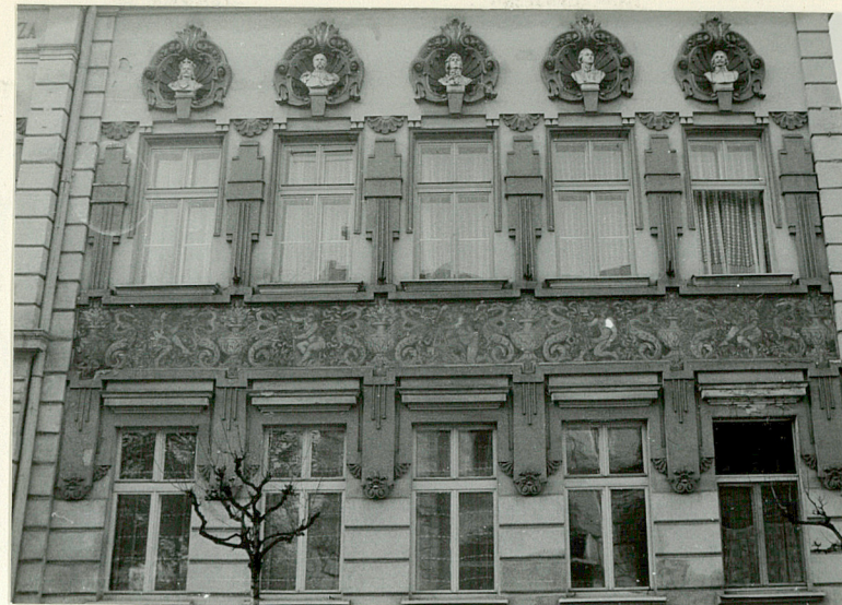
Wschodnia część fasady