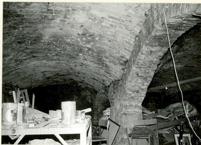
Piwnica w części północnej

Fotografia dodatkowa + plan Nowego Sącza z 1929 r.