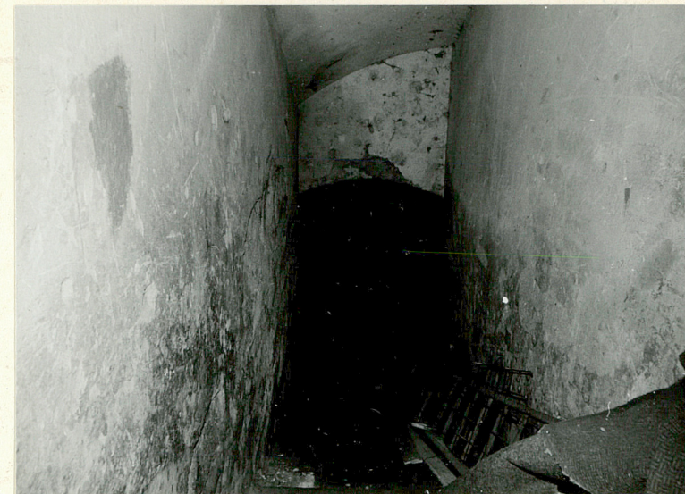
Zejście do piwnicy w części północnej