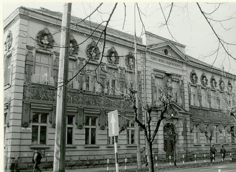
Fasada od wschodu