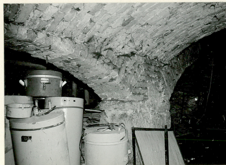
Piwnica w części północnej