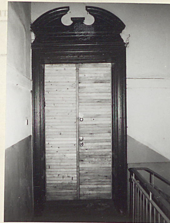
Putryna drzwi na klatce schodowej piętra