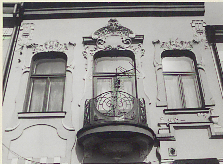
Fragment fasady na wysokości piętra

i profilowanymi splotami, nad oknami i balkonem piętra zwieńczone delikatnymi ornamentami związanymi i typu "rocaille". W polu ornamentów nad oknami - wypukłorzeźby przedstawiające "Orła polskiego" i "litewską Pogoń". Ornament nad drzwiami balkonowymi /w polu którego "główka anioła"/, wsparty na profilowanym gzymsie naddrzwiowym. W górnych narożnikach elewacji - tarcze z gmerkami ujęte w ornamenty. Pod okapem dachu - szeroki gzyms koronujący. W środkowej części elewacji, na wysokości piętra balkon w kształcie konchy z żelbetową płytą balkonową i z balustradą z ozdobnie giętych, metalowych prętów. Płyta balkonowa wsparta na wspornikach i "misie", zdobionych liśćmi akantu.