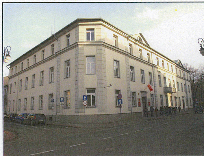
widok od północnego-zachodu