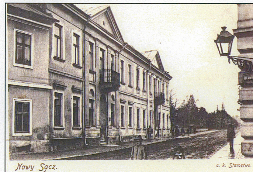
widokówka zapewne z lat międzywojennych