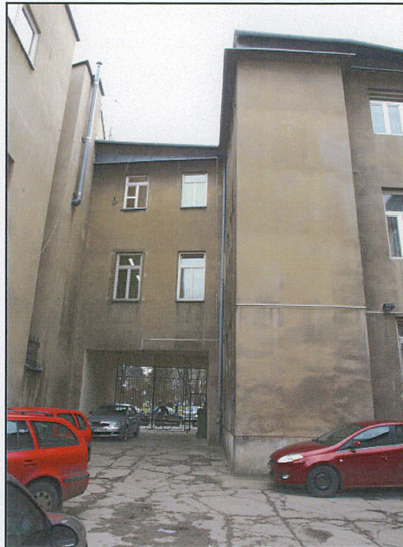
elewacje od dziedzińca