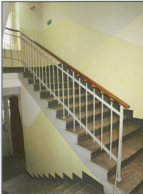
główna klatka schodowa