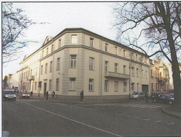
widok od południowego-zachodu