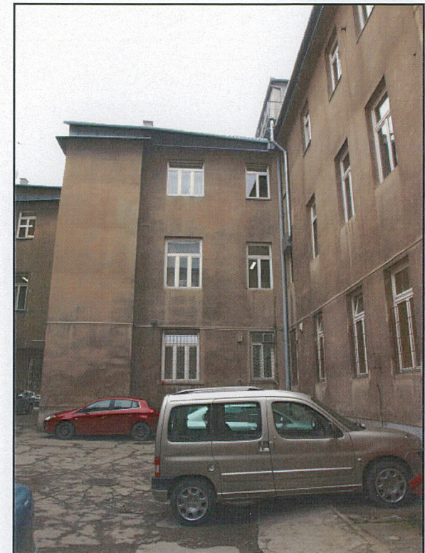
elewacje od dziedzińca (strona południowa)