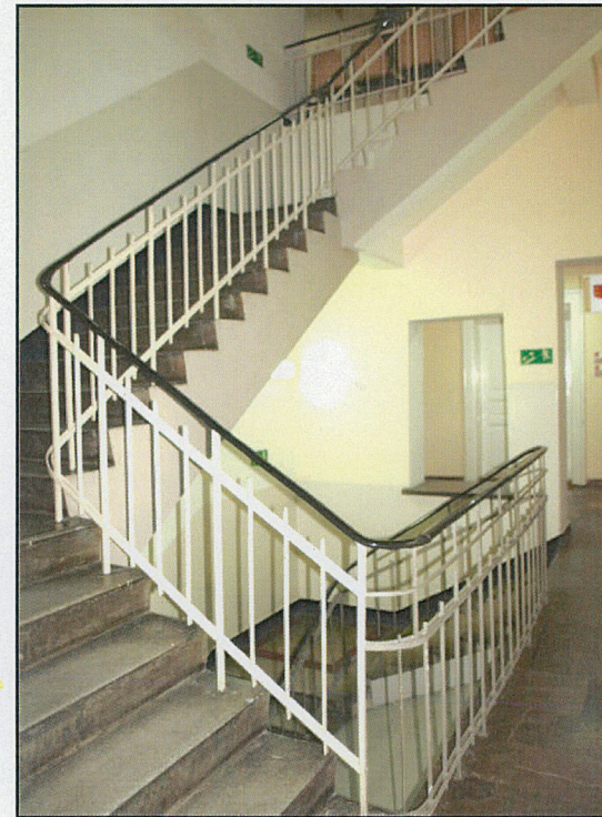
klatka schodowa w części południowej