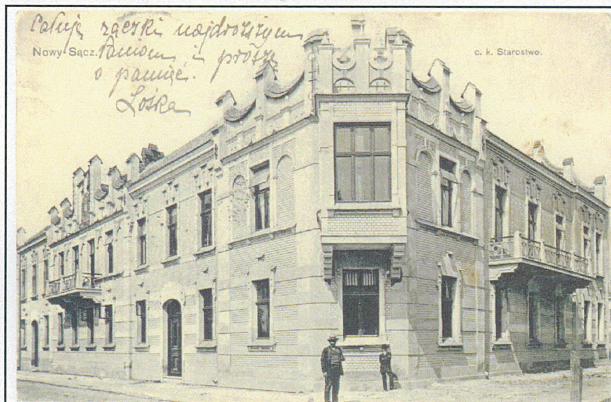
widokówka wykonana po 1906 r.