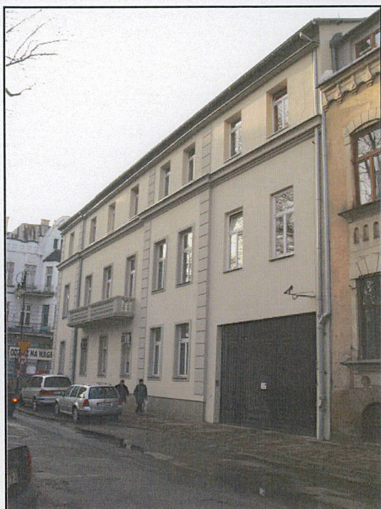
elewacja od ul. Konarskiego