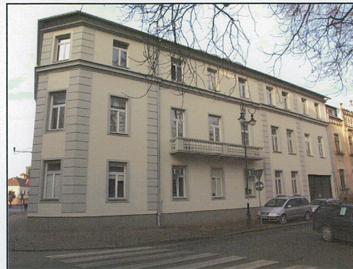
widok od południa z Plantacji Miejskich