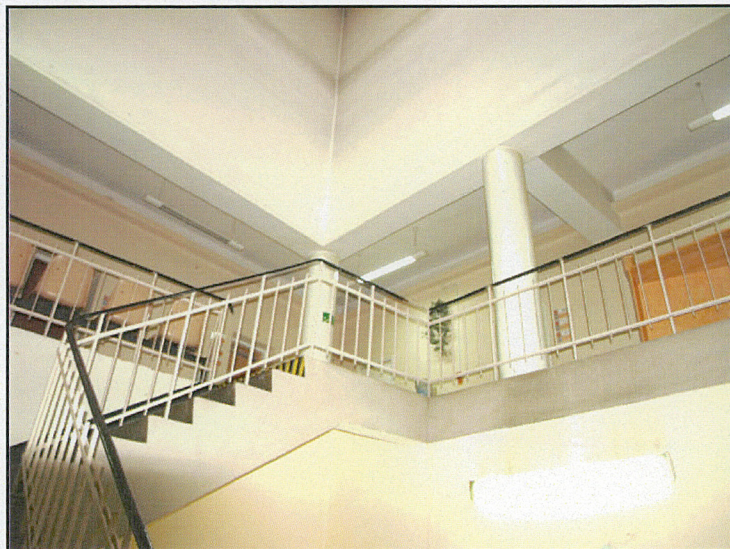
nadbudowa z 1961 roku