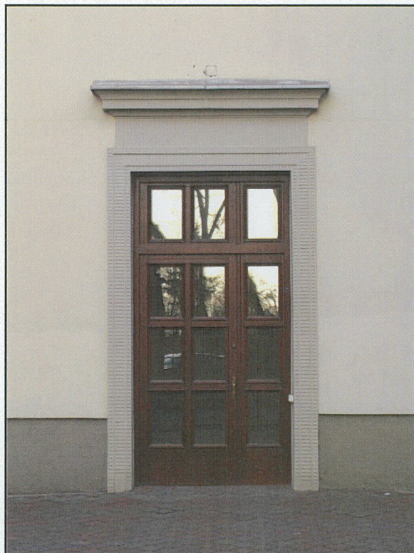
brama w elewacji od ul. Jagiellońskiej