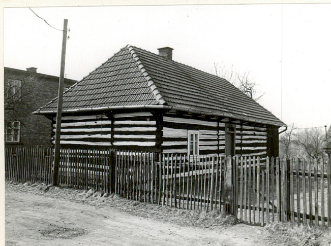
data wykonania fot. T. Kalarus, IV 1978 miejsce przechowywania negatywów /neg. PP PKZ/