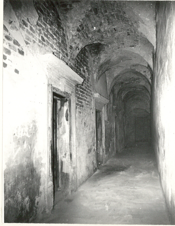
KORYTARZ NA I PIĘTRZE KLASZTORU