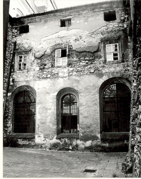
WIDOK Z WIRYDARZA NA SKRZYDŁO PD.