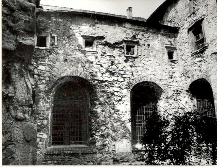
WIDOK Z WIRYDARZA NA SKRZY- DŁO PN. KLASZTORU