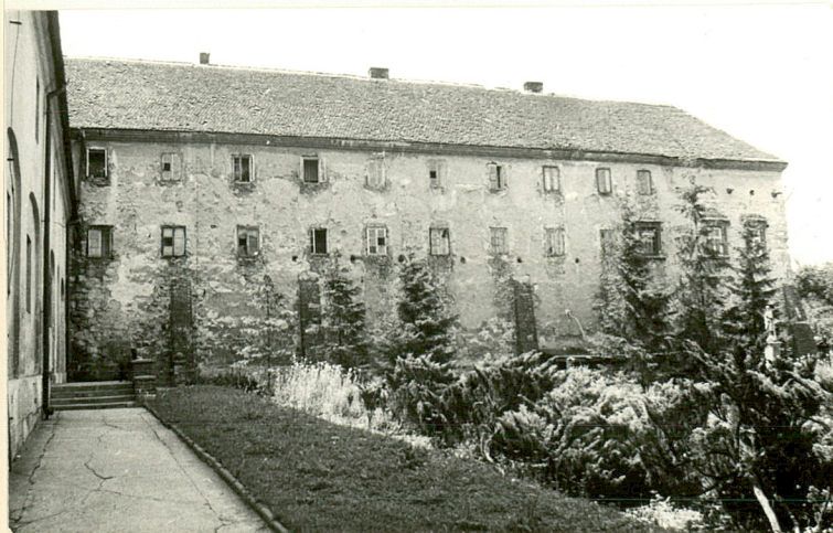
ELEWACJA WSCH. CZWOROBOKU