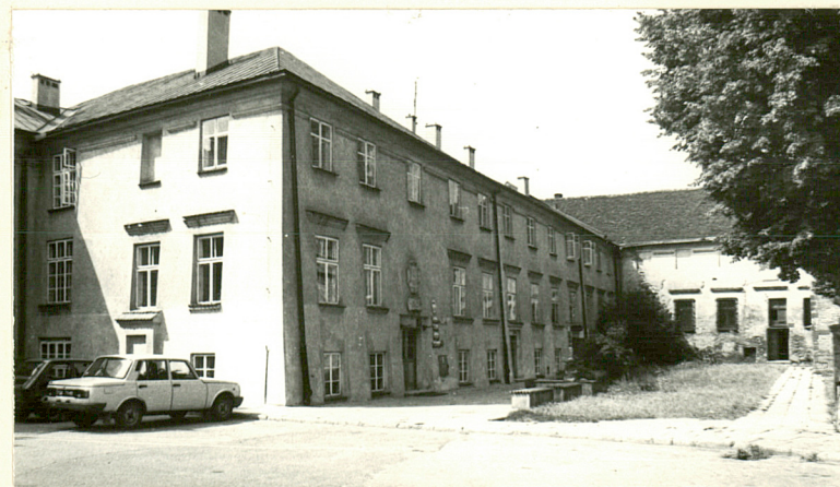
BUDYNEK SĄDU, WIDOK OD STRONY PD.-WSCH.

Wkładkę założył: Olgierd Chojnacki - sierpień 1992 r. (imię, nazwisko, data)