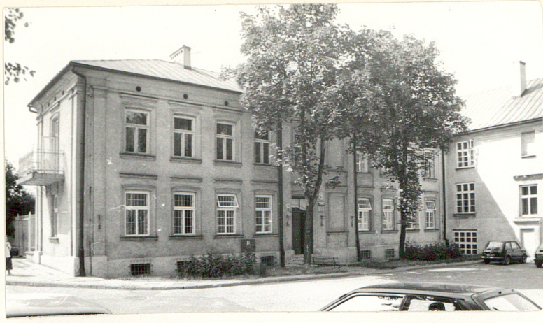
ELEWACJA WSCH. BUDYNKU PROKURATURY