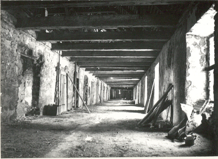
KORYTARZ NA II PIĘTRZE KLASZTORU