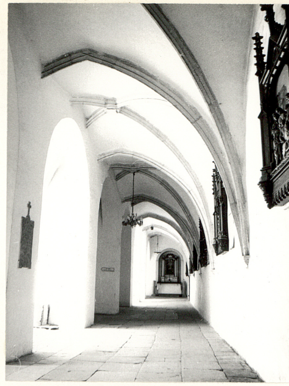
FRAGMENT KRUZGANKA W PRZYZEMIU