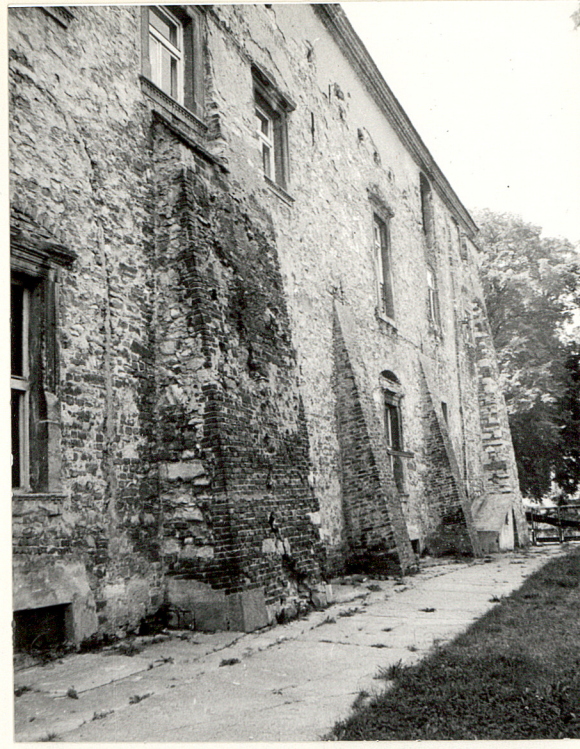
FRAGMENT ELEWACJI PN. KLASZTORU