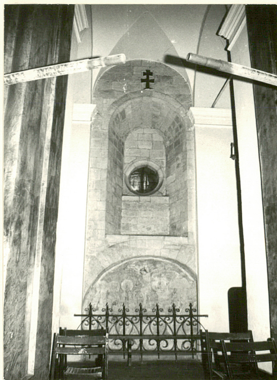
FRAGMENT FASADY ROMAŃSKIEJ