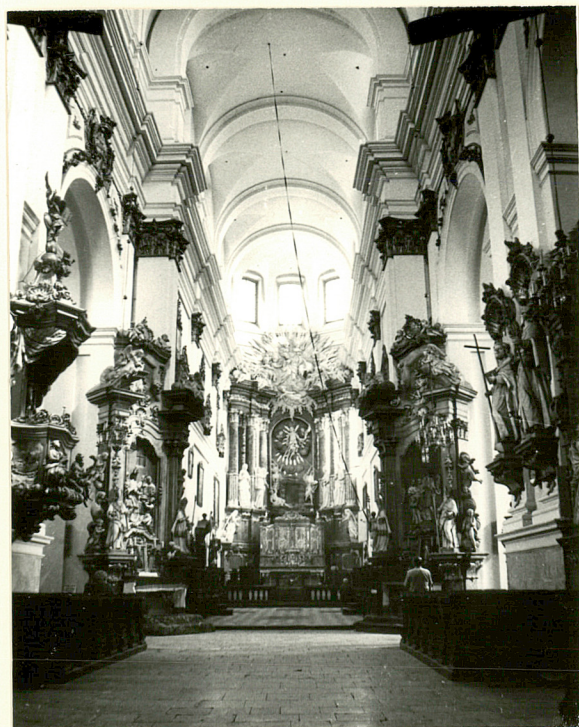
WIDOK NA PREZBITERIUM