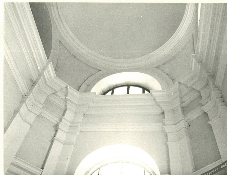
FRAGMENT WNEŹRZA KRUCHTY