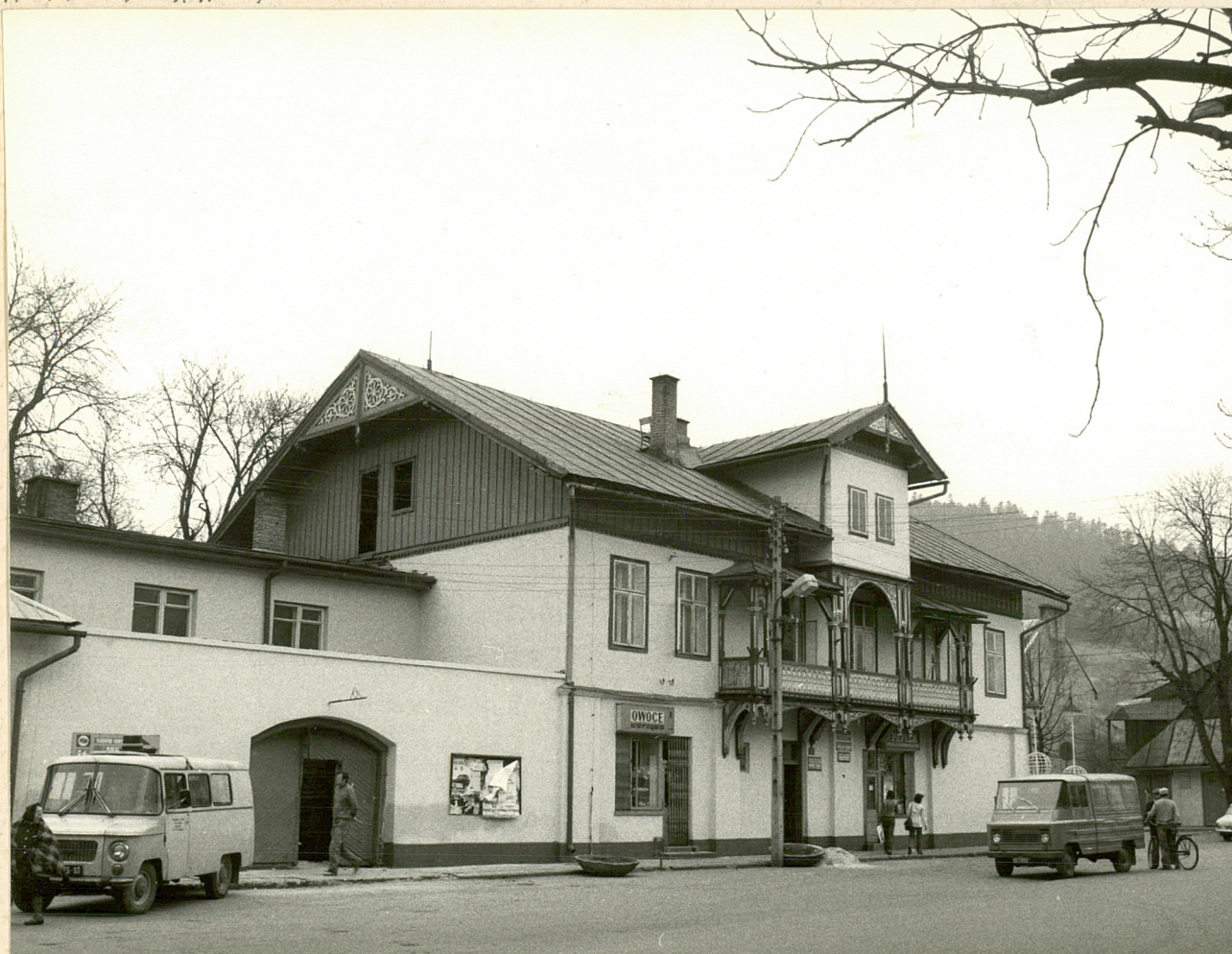
fot. J.Krzyszowski 1979, neg nr 23756/A, PKZ Kraków

autor zdjęć data wykonania miejsce przechowywania negatywów