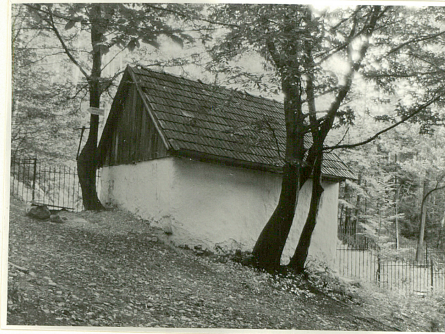
widok od zachodu