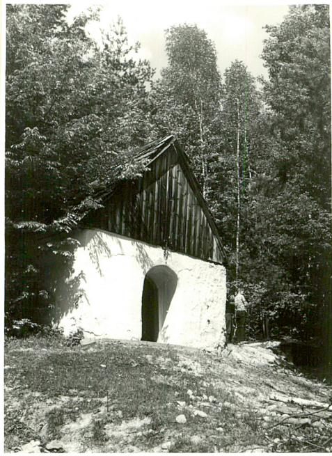
widok od płd-zach