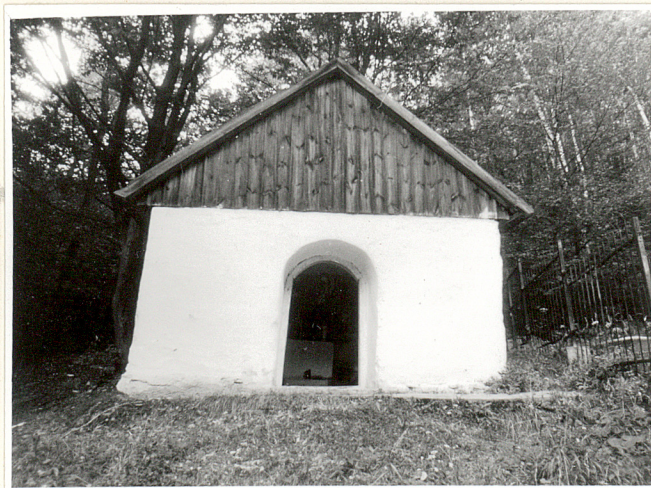
widok od południa