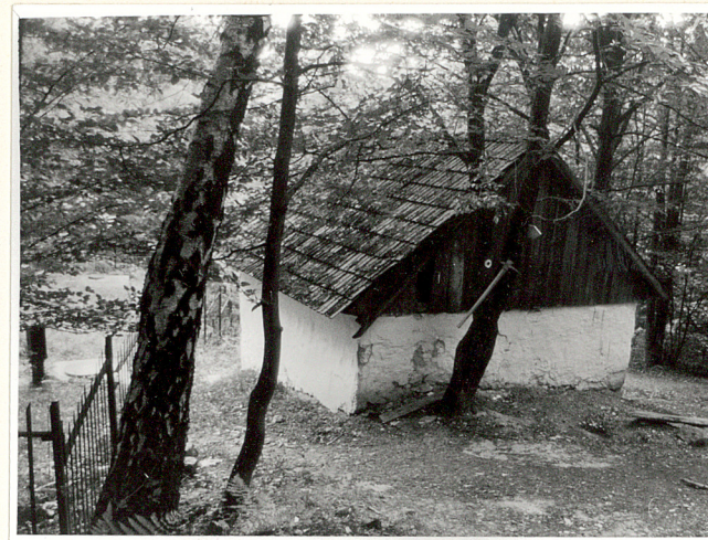
widok od północy