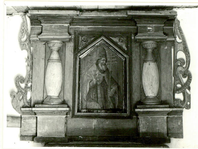
ołtarzyk z obrazem św. Urbana