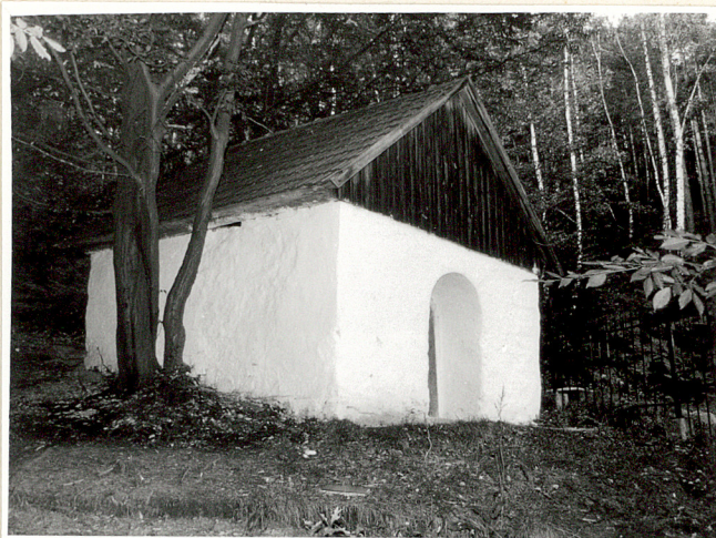
widok od płd-zach.