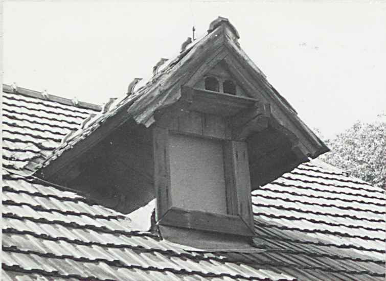
Wystawka w dachu