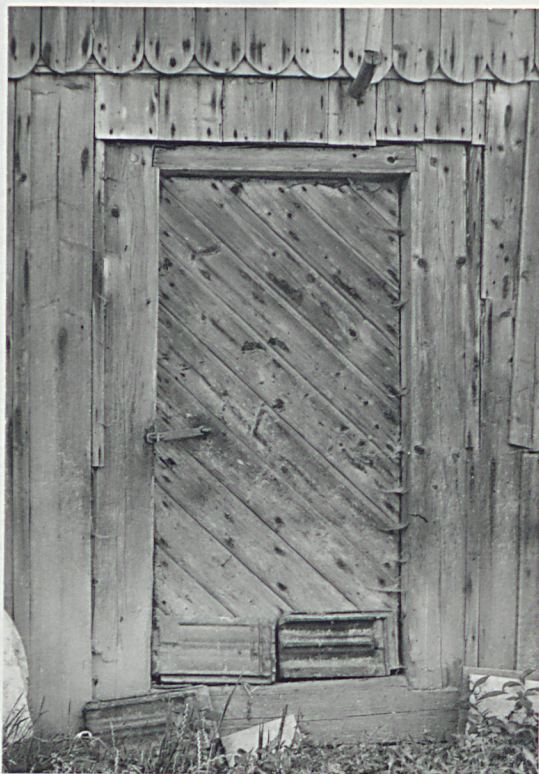
Drzwi do stajni od północy

prostokątnych, nieprzejezdnych boisk i stajni. Piwnica składa się z dwóch prostokątnych pomieszczeń połączonych wąskim korytarzykiem Bryła . Obiekt o zwartej, prostopadłościennych bryle. Podpiwniczony pod częścią zachodnią. Poddasze zagospodarowane na suszarnię i gołębnik. Przy szczycie wschodnim, aneks. Szalunek ściany frontowej od północy, dółem wycinany półkoliście. Instalacje. Obiekt w stajni posiada instalację elektryczną.