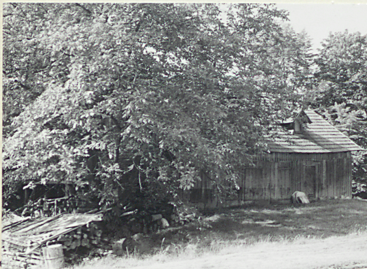
Widok od północnego-wschodu