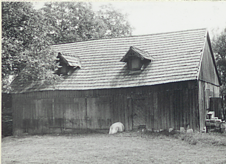
Widok od północnego-zachodu