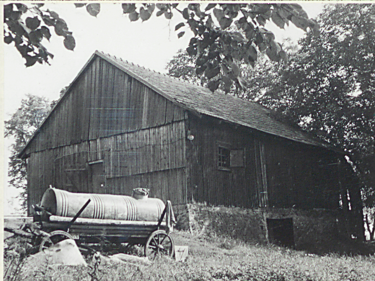
Widok od południowego-zachodu