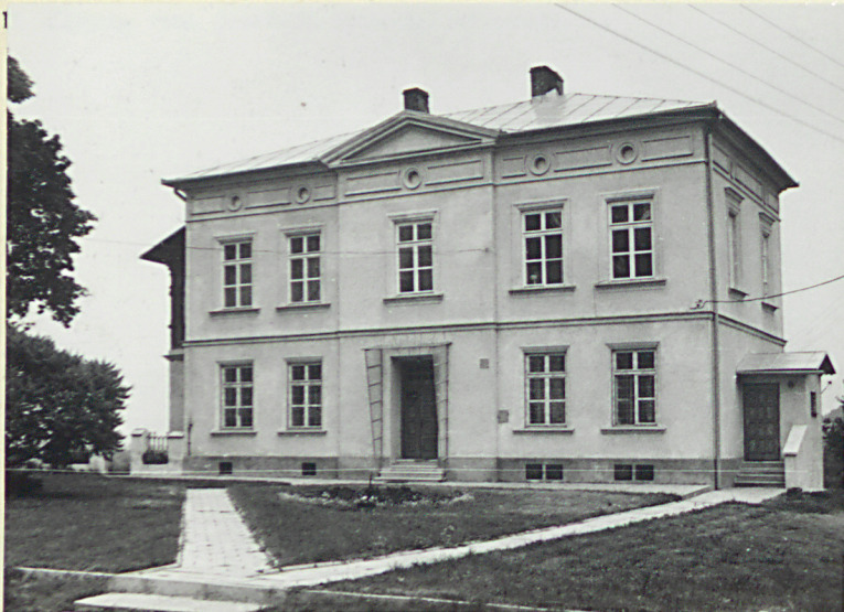
Widok od południowego-zachodu