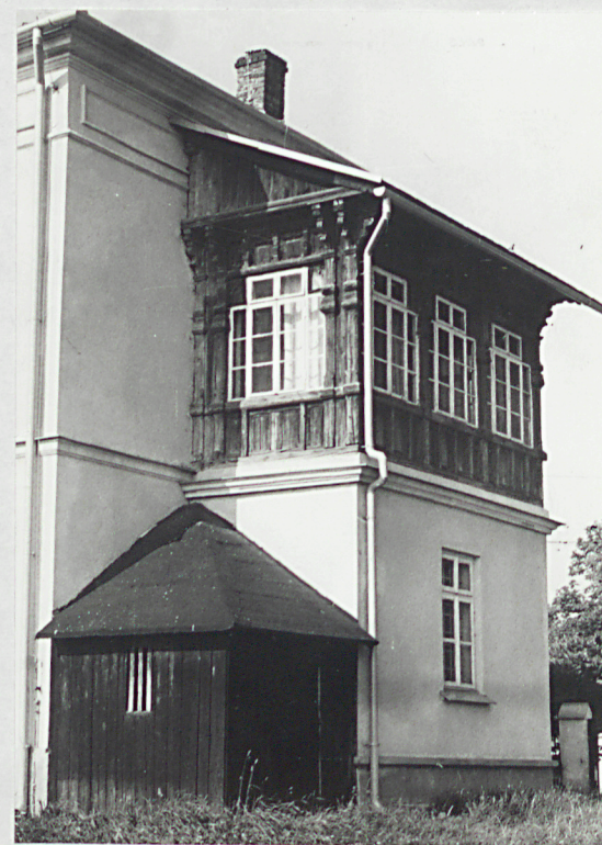
Weranda od północnego-wschodu

Instalacje. Instalacja elektryczna od 1956 r. Ogrzewanie centralne /pierwotnie piece kaflowe/. Instalacja wodno-kanalizacyjna.