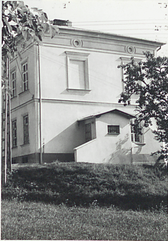
Ganek z wejściem do kuchni od południa

Wkładkę złożył: mgr Tadeusz Gładzikowski, VII 1994 r. (mgr, architekt, dom)