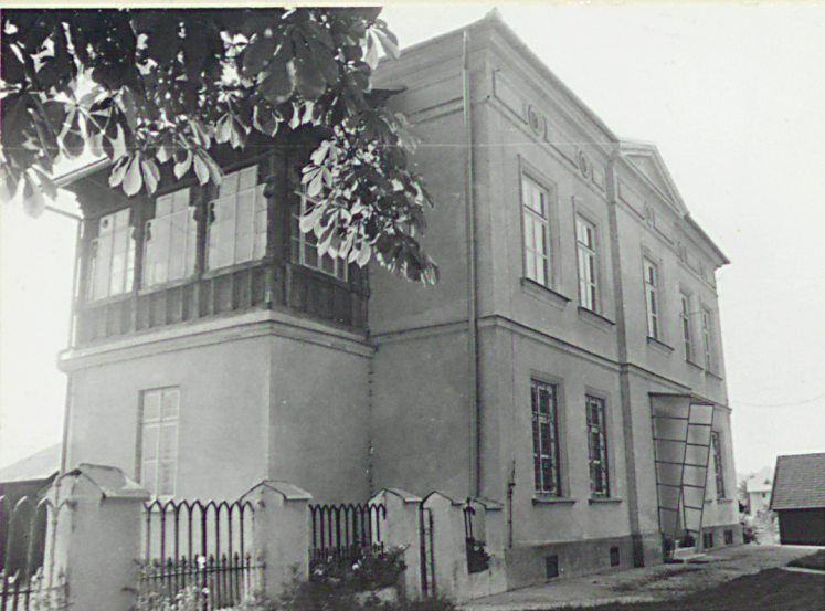
Widok od północnego-zachodu