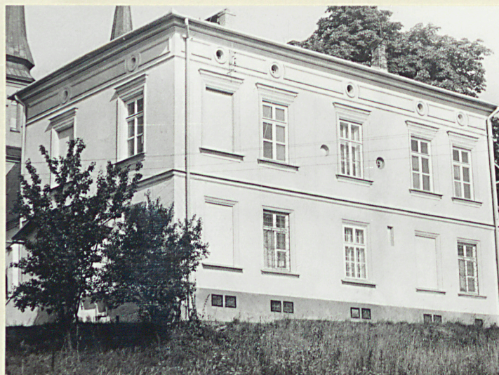
Widok od południowego-wschodu