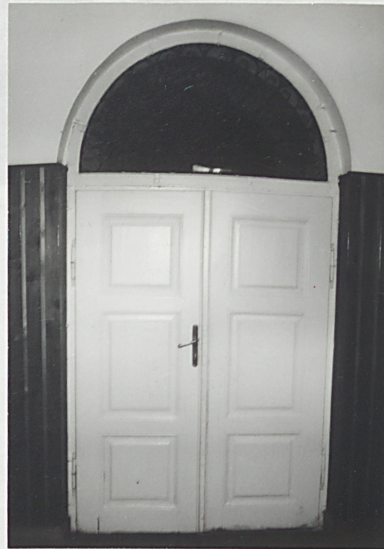
Drzwi z holu do korytarza na parterze