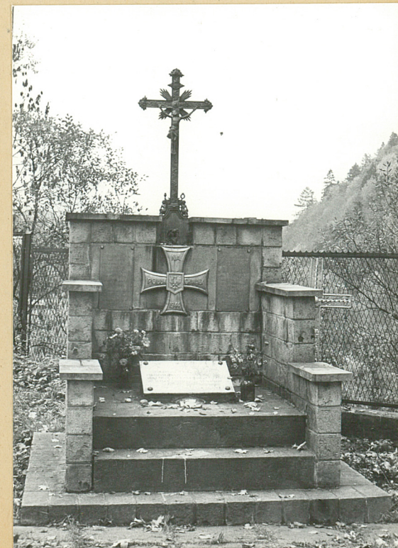
14. GRÓB 5 ŻOŁNIERZY AK POLEGŁYCH W 1944