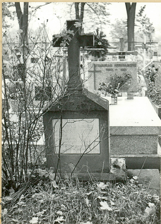
12. AUGUSTYN BUCHS, 1908