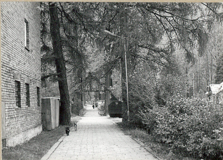
4. WEJŚCIE NA CMENTARZ