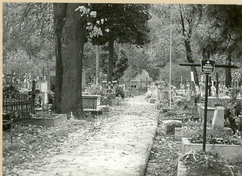
7. ALEJA W STRONIE P.D.