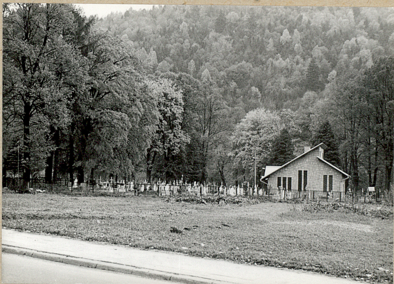
1. WIDOK Z ULICY