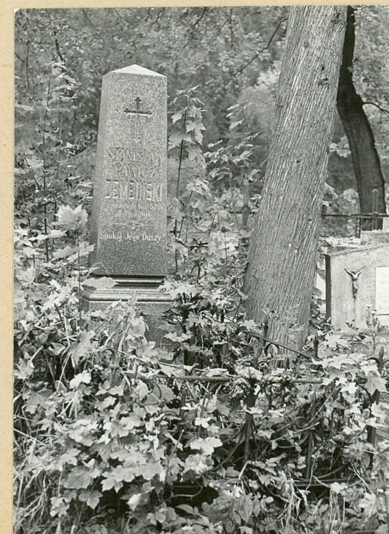
9. STANISŁAW RAWICZ DEMBIŃSKI 1900