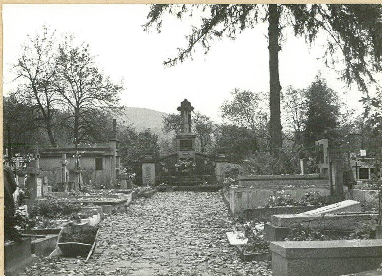
5. ALEJKA BOGNA