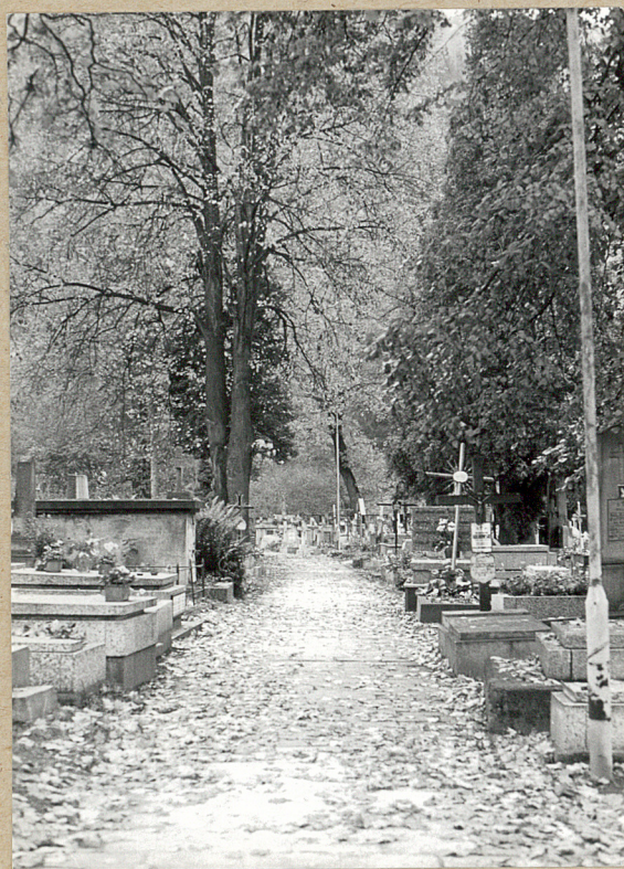
3. ALEJKA OD WEJŚCIA