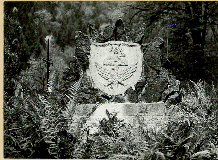
11. ERNEST DURKALEC, 1944