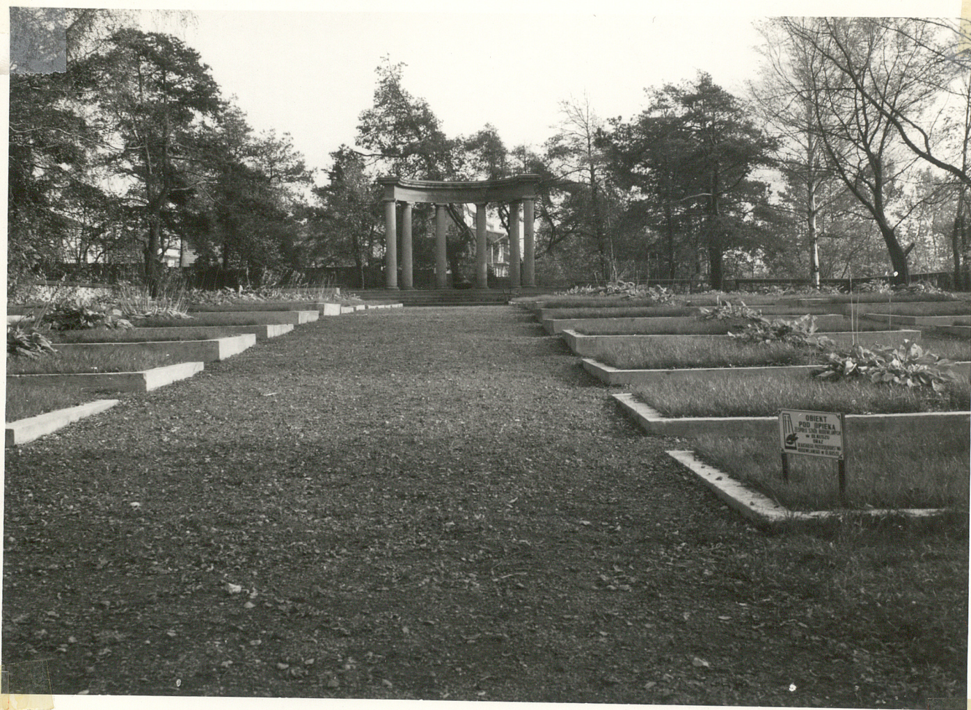
WATERA ŻOKNIEŹY POLSKICH