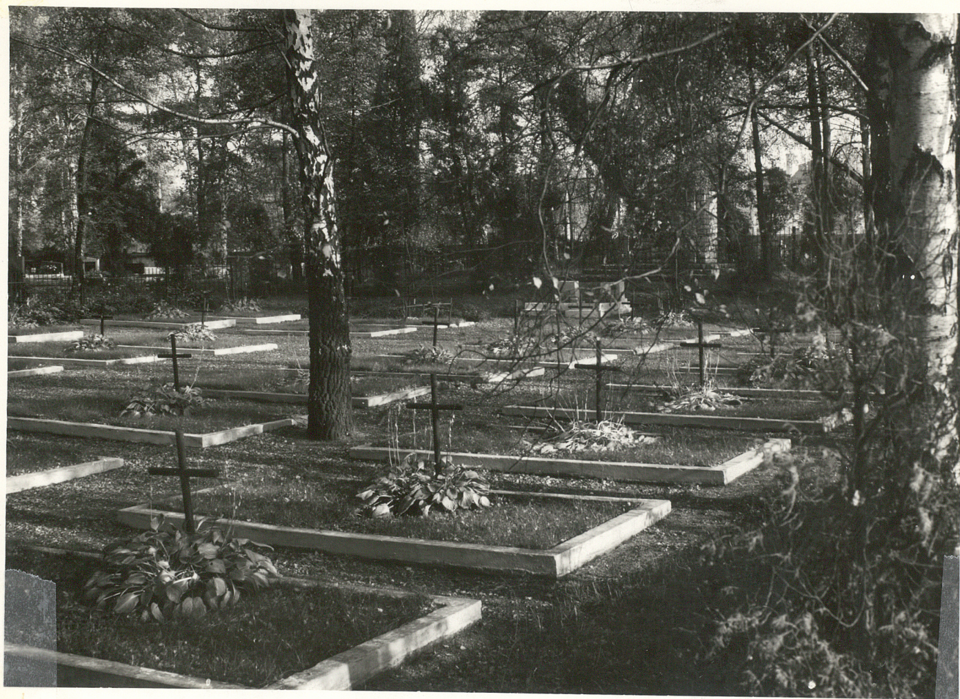
WATERA ŻOKNIEŹY POLSKICH