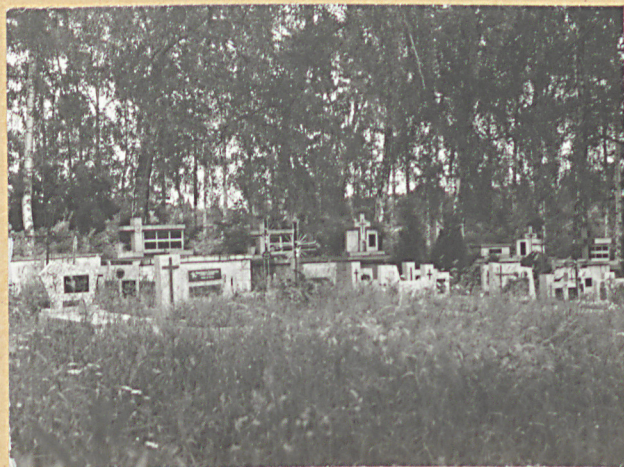
5. STRONA WSCH.