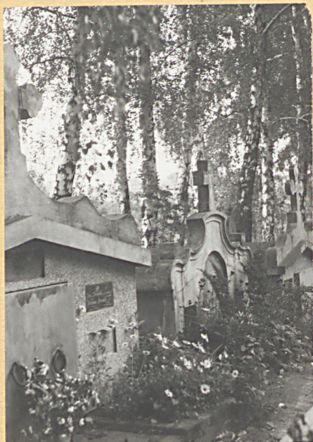
6. GROBOWCE Z LAT 40-TYCH XXW.