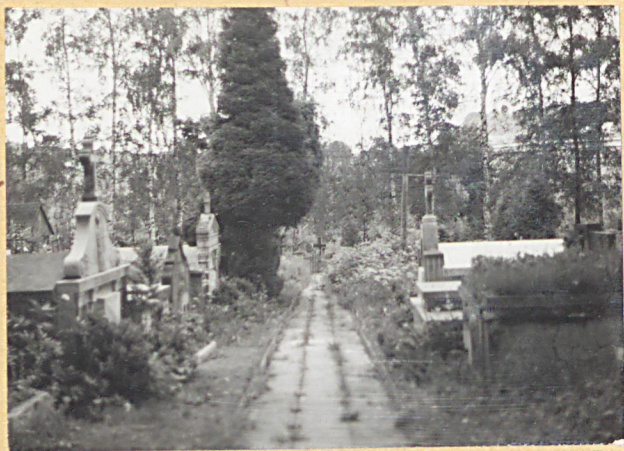
12. ALEJKA DO KWATERY WOJENNEJ