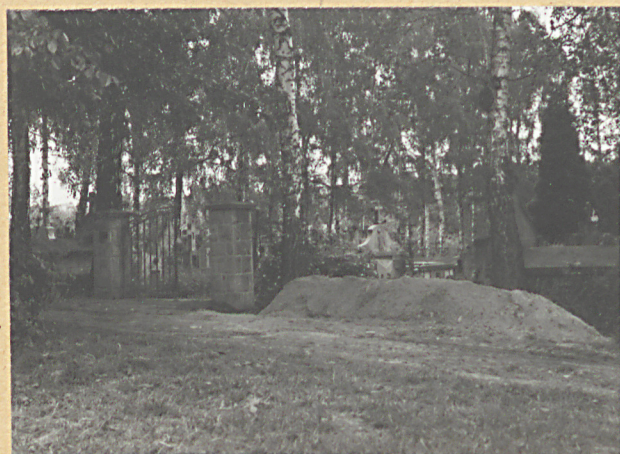
3. BRAMA WEJŚCIOWA ZACH.