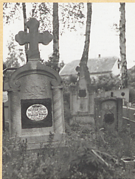
7. STANISŁAW WOŹNIAK 1947