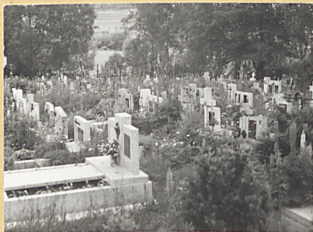
11. WSPÓŁCZESNE GROBY W STR. PD.