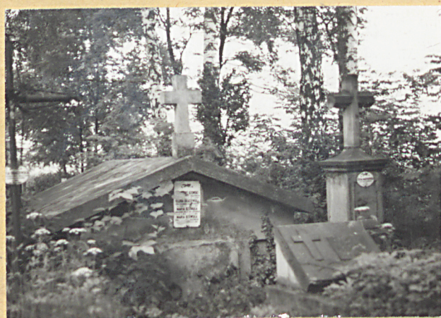
9. GROBOWIEC RODZINY BZOWSKICH I BARONÓW POSTKOWSKICH 1921