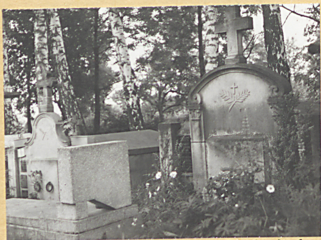
8. GROBOWCE Z LAT 40-TYCH XXW.