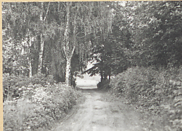
1. DROGA DO KOŚCIOŁA