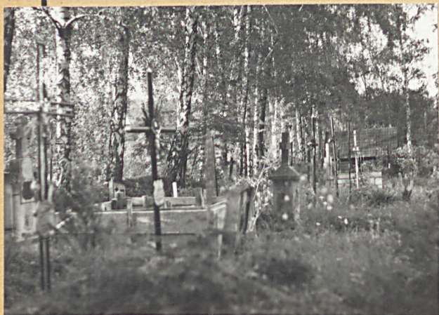
4. STRONA PN.