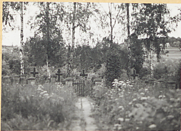
13. WIDOK OGÓLNY KWATERY WOJENNEJ