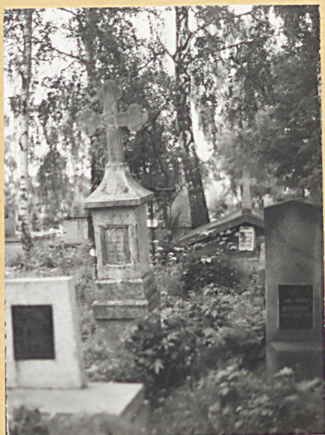
10. ZOFIA MARYNOWSKA 1931