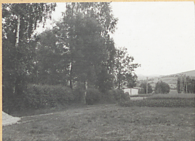
2. WIDOK Z DROGI - STR. PD. - ZACH.