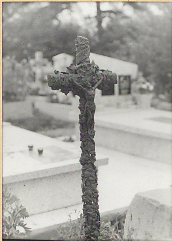
2. KRZYŻ ŻELIŃNY NY