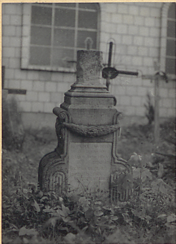
5. KAROLINA JAWORSKA 1927