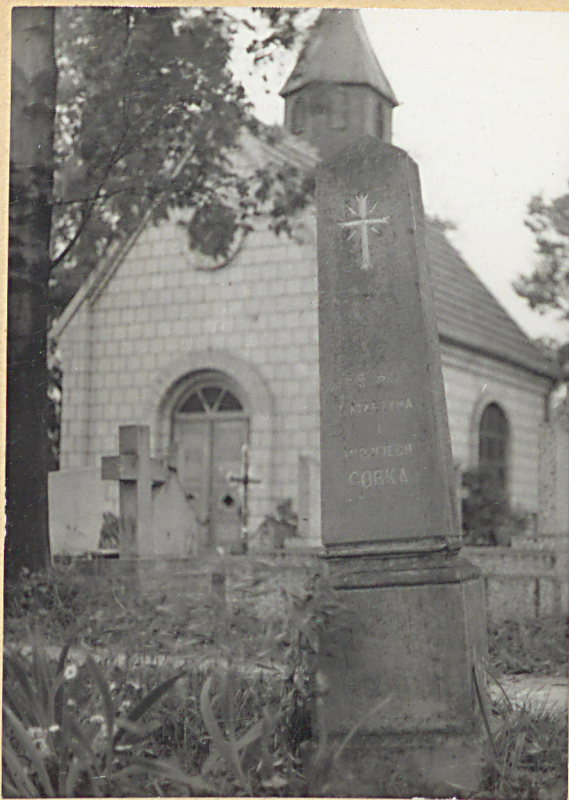
6. KATARZYNA GÓRKA