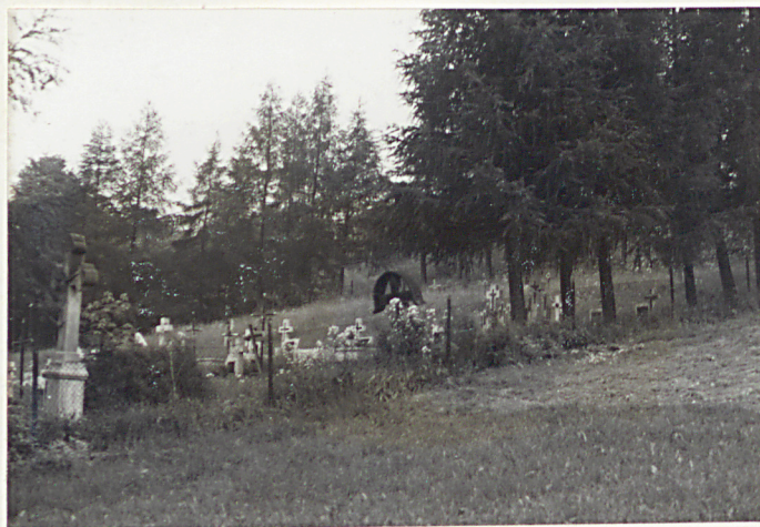
5. Widok ogólny.