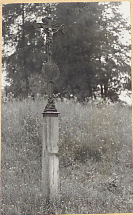
1. Krzyż żel. na drewn. cokole