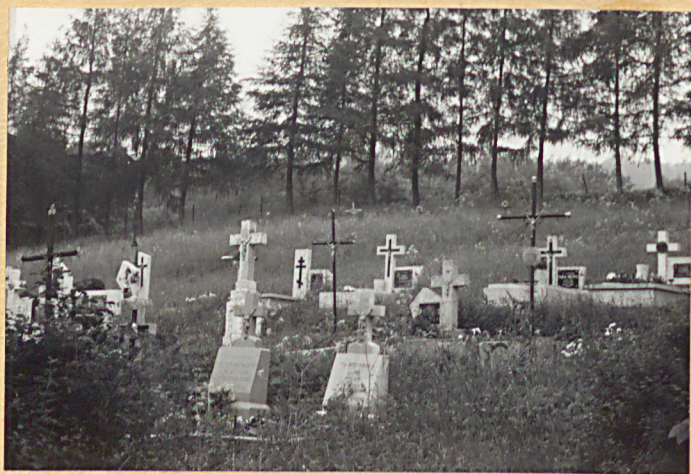
4. Widok ogólny