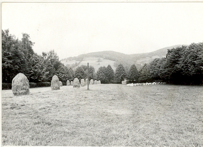
2. Widok ogólny