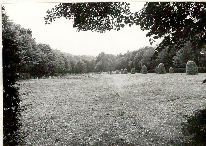
5. Widok od kościoła