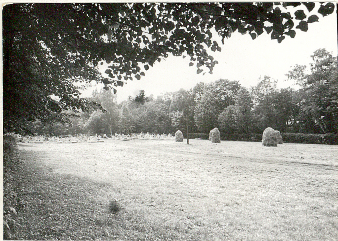
3. Widok ogólny