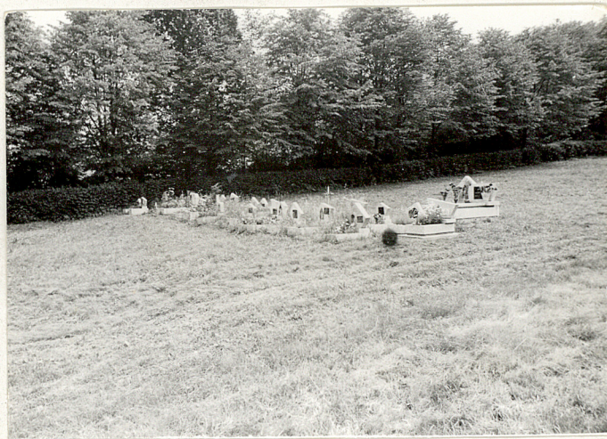
4. Kwatera dziecięca