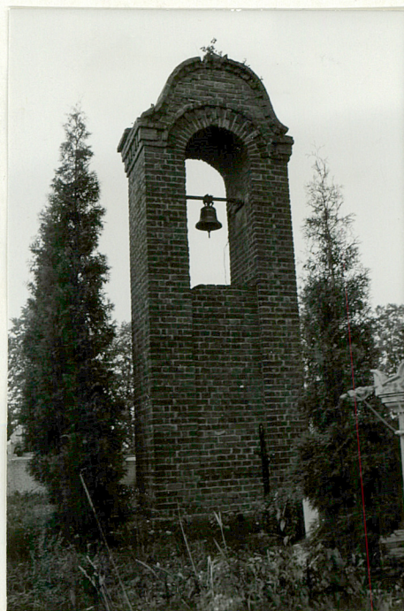
14. Dzwonnica murowana