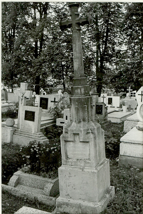
5. Nagrobek kamienny Ludwin Michał + 1900r.