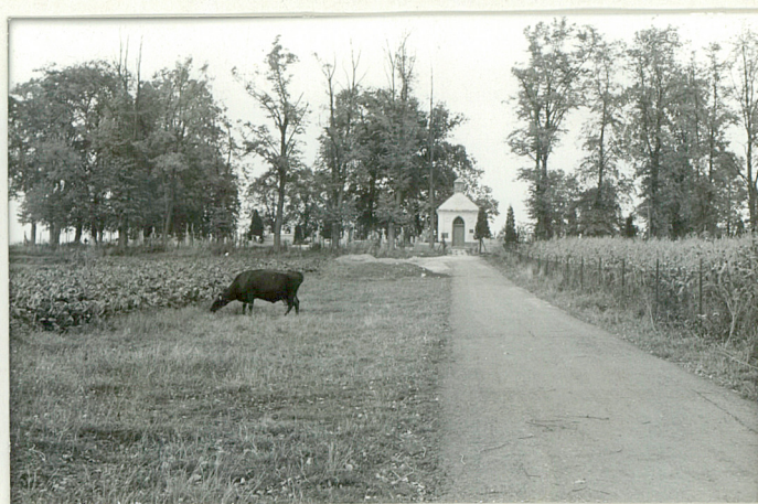
31. Widok od strony wsi