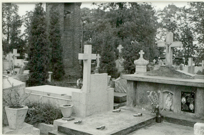
30. Widok ogólny