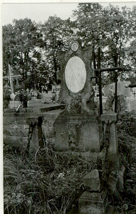
12. Nagrobek kamienny z pocz. XIX w. (napis zniszczony)