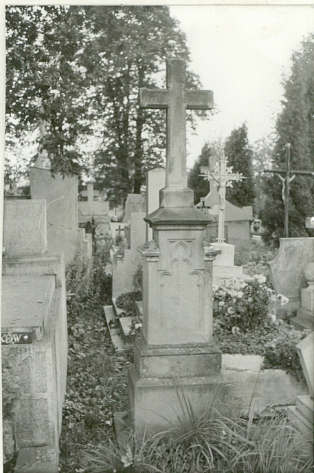
24. Nagrobek kamienny z k. XIX w. (napis nieczytelny)