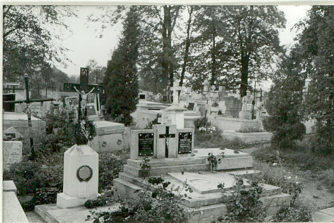
29. Widok ogólny