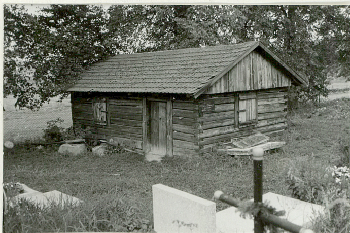
20. Budynek gospodarczy