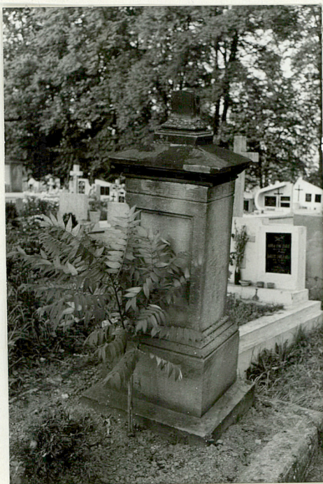
7. Nagrobek kamienny Paweł Stepień + 1881r.