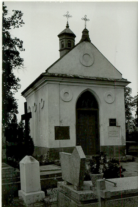
17a. Kaplica grobowa