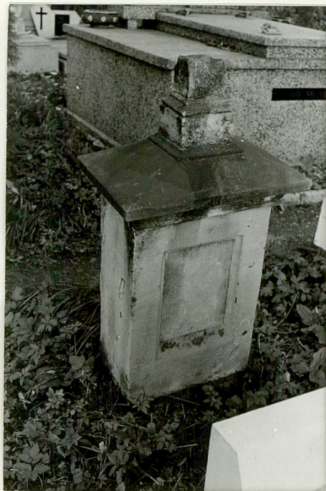
6. Nagrobek kamienny Jakób Duda + 1895r.