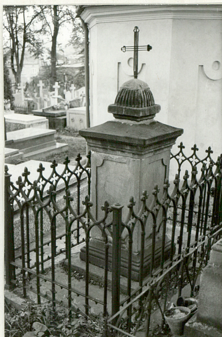
23. Nagrobek kamienny z k. XIX w. (napis nieczytelny)