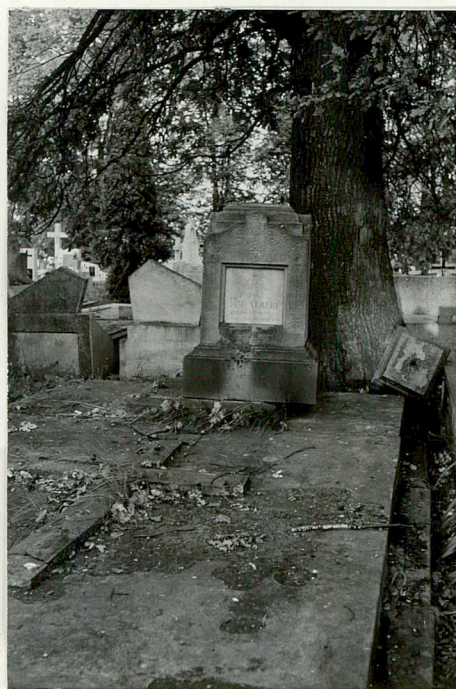
10. Nagrobek kamienny ks. Hipolit Ryznerski k. XIX w.