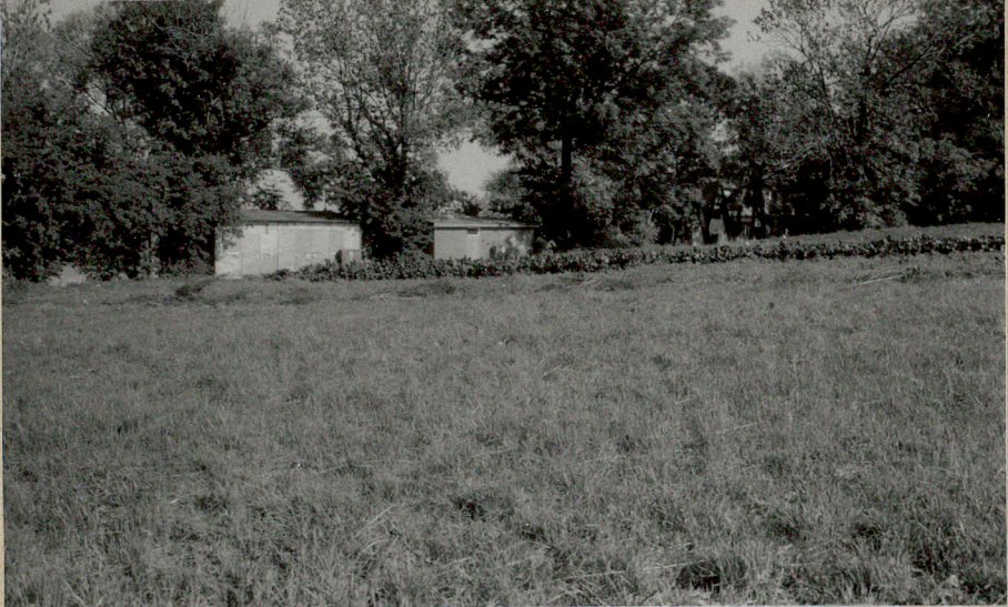
2. STRONA POŁUDNIOWA