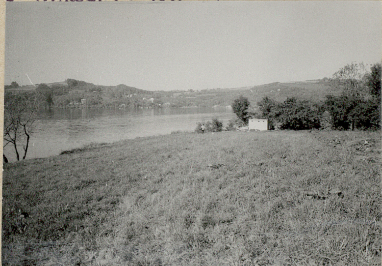
4. STRONA WSCHODNIA