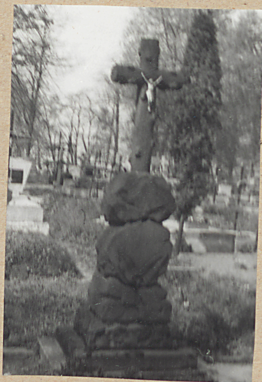
NAGROBEK KSIĘNY BASOŁKOWEJ +1836