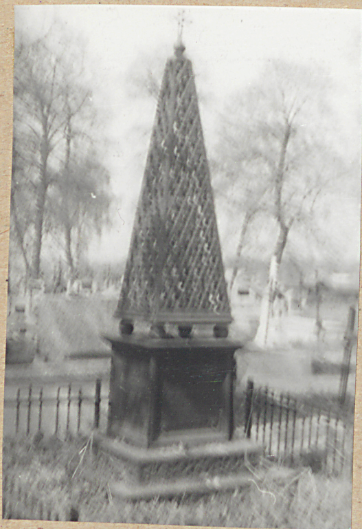
NAGROBEK KAZIMIERZA POMIKLEWSKIEGO +1900