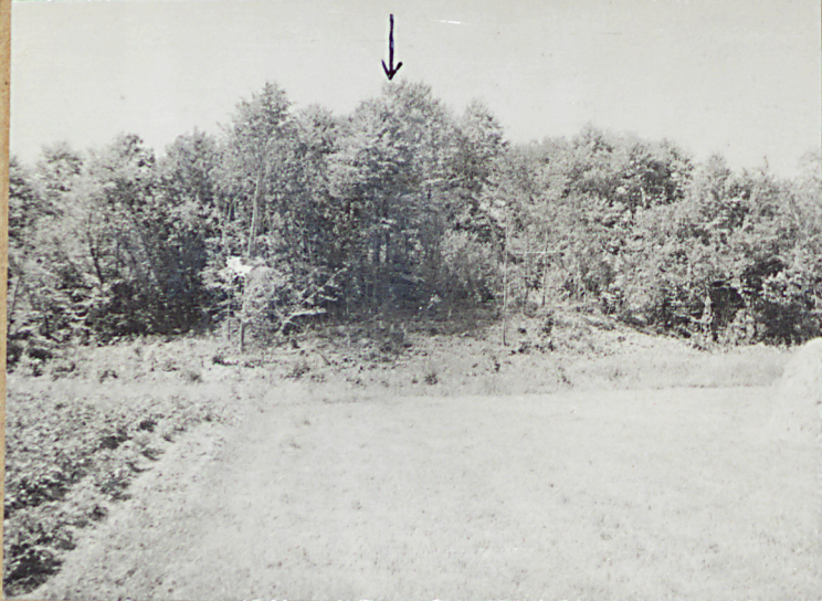
1. WIDOK Z SZOSY OD WSCHODU