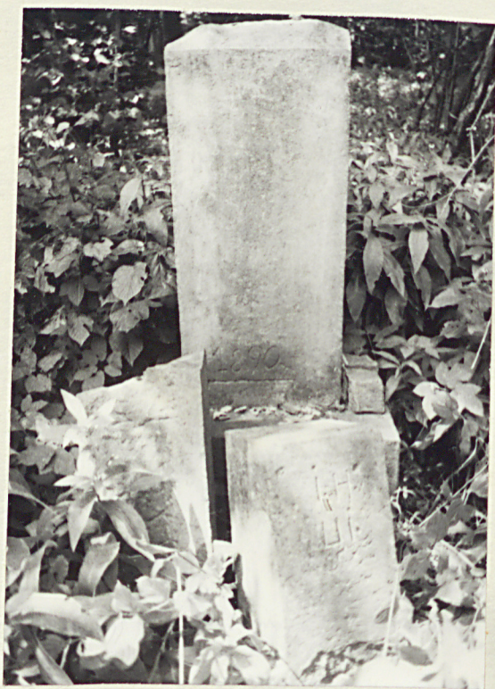
8. NN 1890