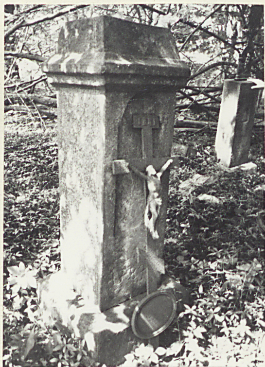
6. NN 1887