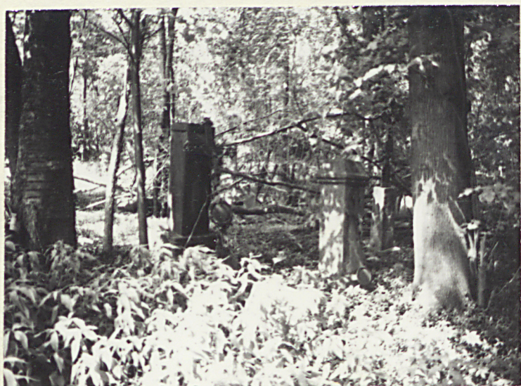
5. L- NN P- NN 1887