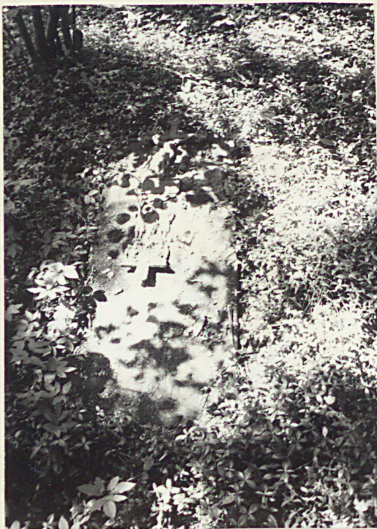
15. NN 1890