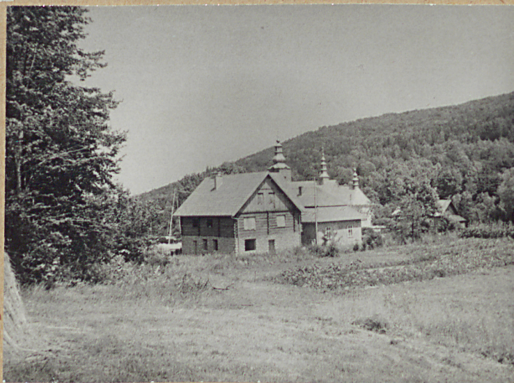
2. WIDOK Z CMENTARZA NA KOŚCIÓŁ