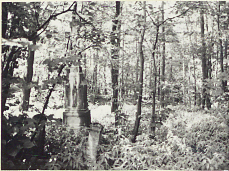
13. WIDOK OGÓLNY