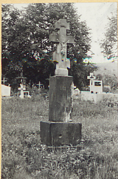
1. Krzyż kamienny z 1938r. /napis niszczelny/