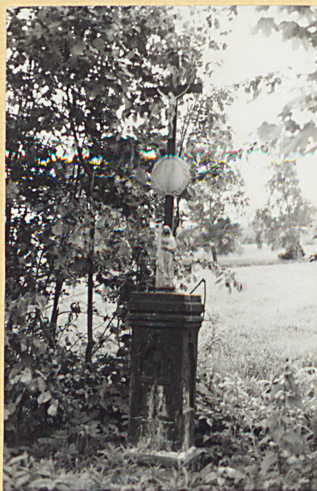
2. Nagrobek z krzyżem żel. z 1891r. /napisów brak/