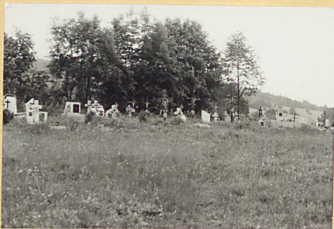
2. Widok ogólny