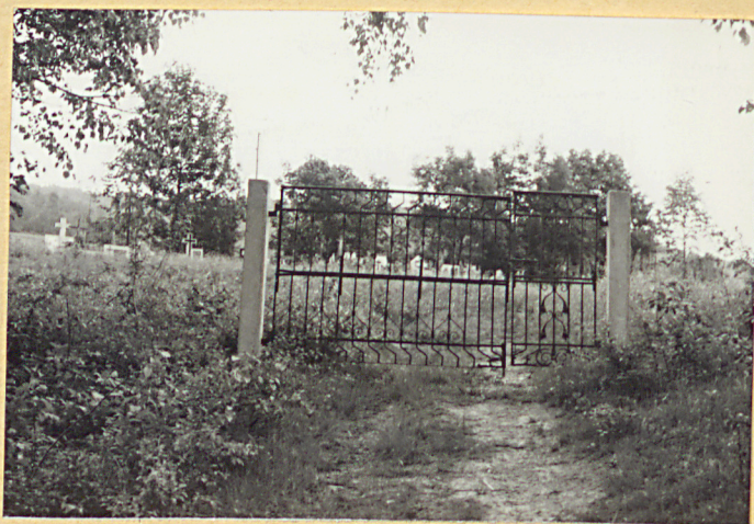
4. Brama cmentarna